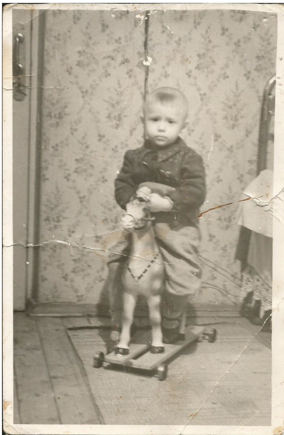
С любимой лошадкой дома в Лефортово, 1961г.