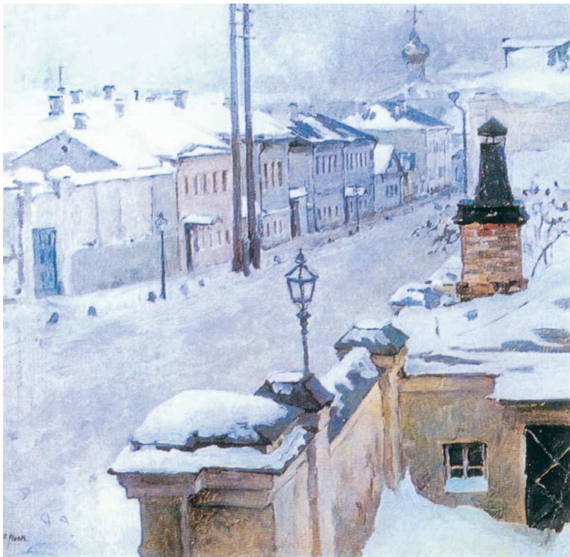
М. Якунчикова-Вебер. Москва зимой

Мы уже весело шагали по Басманной, совершенно безлюдной и тоже темной. Иногда натыкались на тумбы, занесенные мягким снегом. Еще пл ошадь. Большой фонарь освещает над нами подобие окна с темными и непонятными фигурами.