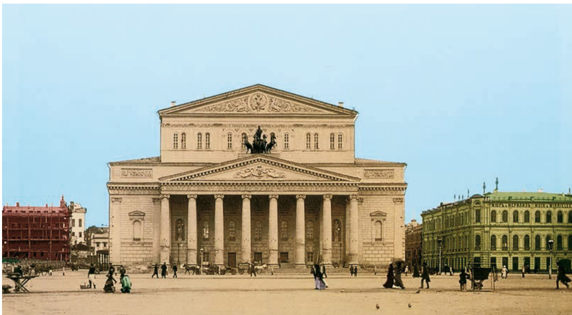
Театральная площадь в начале XX века