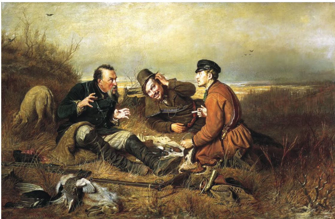
В. Перов. Охотники на привале