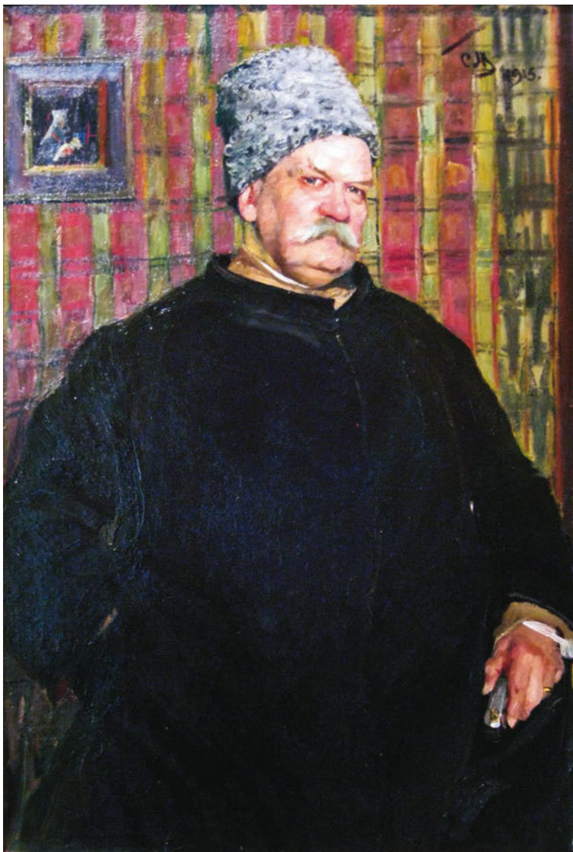
С. Малютин. Портрет В. А. Гиляровского