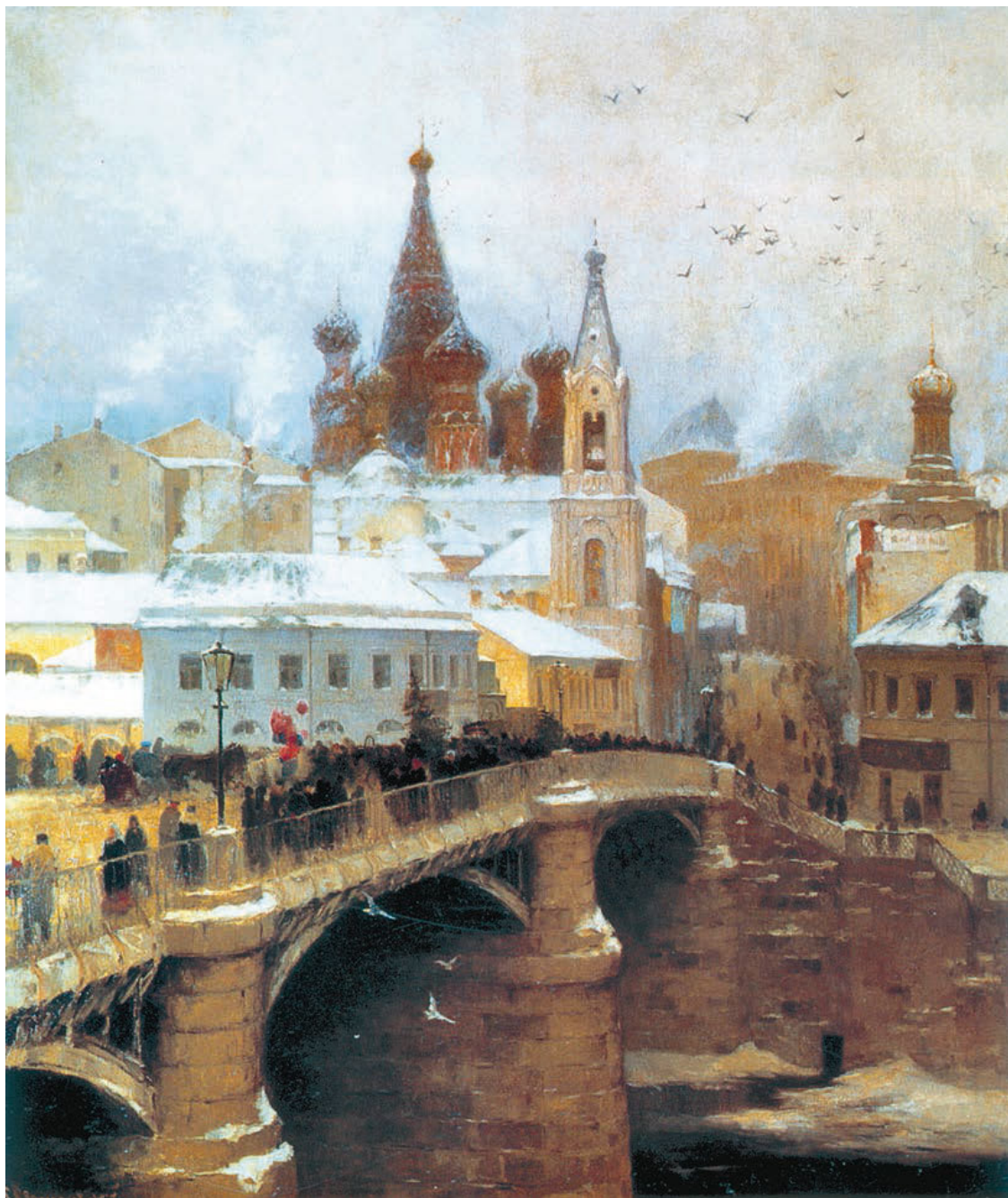
С. Светославский. Москворецкий мост

– В Сибирь на каторгу везут: это – которые супротив царя идут – пояснил полупшепотом старик, оборачиваясь и наклоняясь ко мне.