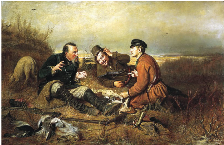
В. Перов. Охотники на привале

Из узлов вынимают дорогие шубы, лисьи ротонды и гору разного платья. Сейчас начинается кройка и шитье, а утром являются барышники и охапками несут на базар меховые шапки, жилеты, картузы, штаны.