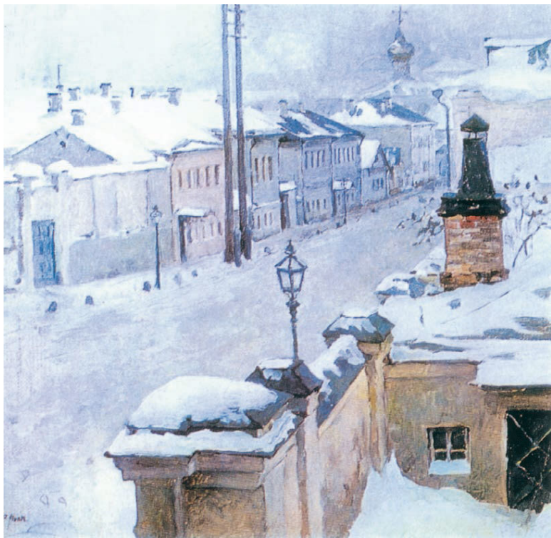
М. Якунчикова-Вебер. Москва зимой

Мы уже весело шагали по Басманной, совершенно безлюдной и тоже темной. Иногда натыкались на тумбы, занесенные мягким снегом. Еще пл ошадь. Большой фонарь освещает над нами подобие окна с темными и непонятными фигурами.