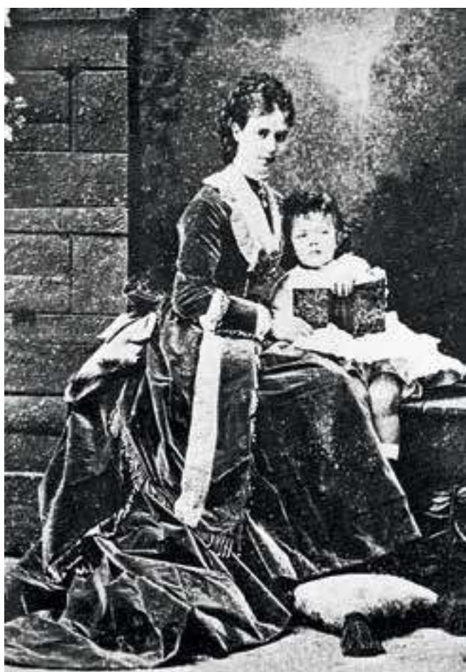
Цесаревна Мария Фёдоровна с сыном Николаем в 1870 г.

6 мая 1868 г. с бастионов Петропавловской крепости раздался 301 пушечный выстрел. Так традиционно столица извещалась о рождении будущего государя. В этот день в семье его императорского высочества государя наследника цесаревича и великого князя Александра Александровича (будущего императора Александра III) родился первенец. Мальчика назвали Николаем – в честь деда, императора Николая I, и старшего брата наследника, рано умершего цесаревича Николая Александровича (1843–1865). Это был долгожданный ребенок. Он появился через полтора года после свадьбы, так что по великосветским салонам уже поползли сплетни о бесплодии цесаревны. Позже в семье Александра Александровича появятся еще пятеро детей: Александр (1869–1870), Георгий (1871–1899), Ксения (1875–1960), Михаил (1878–1918) и Ольга (1882–1960).