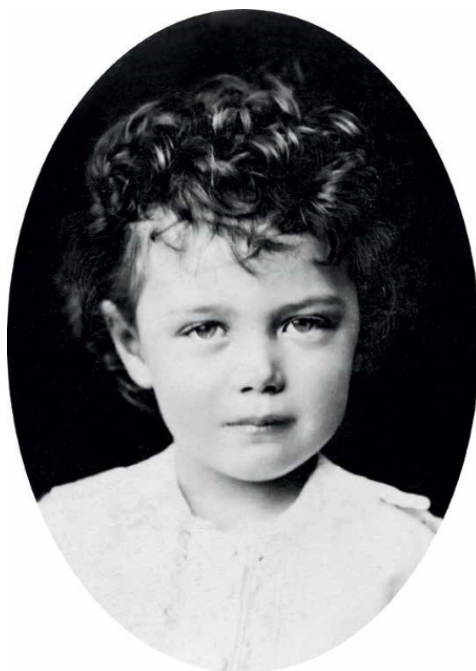
Николай Александрович в 1870 г.