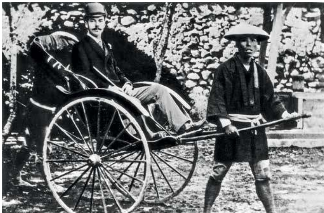
Николай Александрович в Нагасаки. 1891 г.

Первая часть путешествия – морем вокруг всей Азии до Японии – была определена сразу. В дальнейшем предполагалось проехать через всю Сибирь или, посетив Америку, отправиться домой уже оттуда. Николай Александрович сам выбрал первый вариант. Сибирь притягивала его больше, чем Соединенные Штаты, где он собирался побывать «когда-нибудь потом». В отличие от таких же «образовательных» путешествий отца и деда в свите Николая Александровича не было выдающихся государственных и общественных деятелей, да в этом не было и необходимости. Их опыт и знания, необходимые при путешествии по России, оказывались бесполезными при поездке в малоизвестные страны. В качестве «знающих» лиц на разных этапах маршрута выступали русские дипломаты, аккредитованные в тех странах, которые посещал наследник, и европейская колониальная администрация.