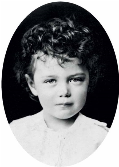
Николай Александрович в 1870 г.

этом каждая его подпись, даже трехсотая за день, должна была выглядеть красиво.