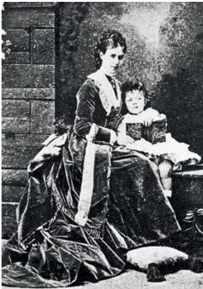
Цесаревна Мария Фёдоровна с сыном Николаем в 1870 г.