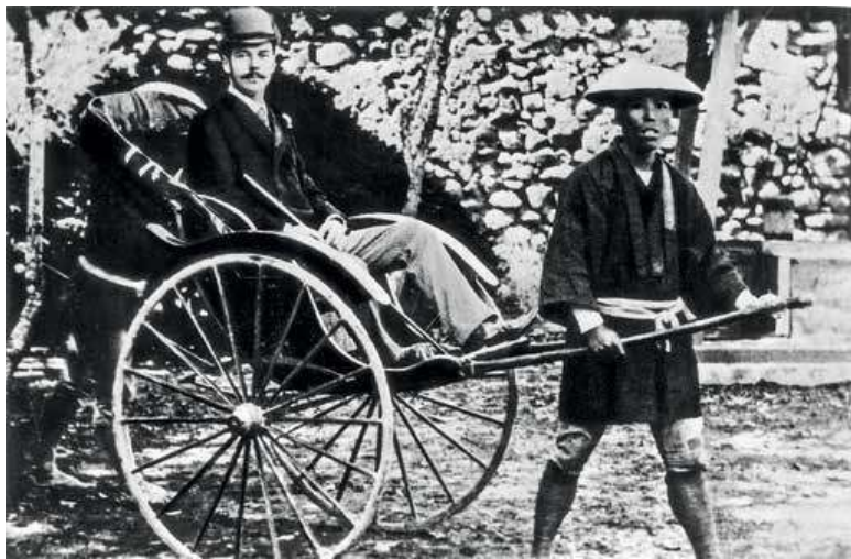
Николай Александрович в Нагасаки. 1891 г.

вича не было выдающихся государственных и общественных деятелей, да в этом не было и необходимости. Их опыт и знания, необходимые при путешествии по России, оказывались бесполезными при поездке в малоизвестные страны. В качестве «знающих» лиц на разных этапах маршрута выступали русские дипломаты, аккредитованные в тех странах, которые посещал наследник, и европейская колониальная администрация.