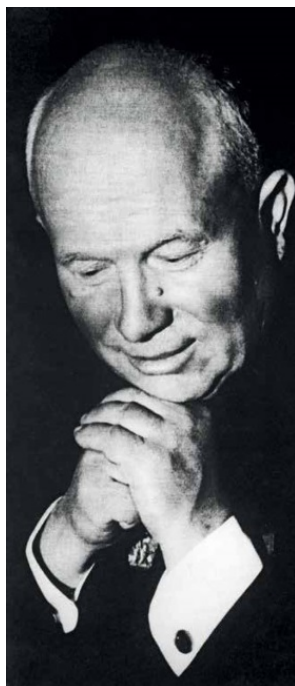
Н. С. Хрущев.

О своих детских и юношеских годах Хрущёв вспоминал редко и, в общем, неохотно. «Вы хотите знать, кто я такой? – спрашивал он и сам же отвечал: – Я стал трудиться, как только начал ходить. До пятнадцати лет я пас телят, я пас овец, потом пас коров у помещика. Потом работал на заводе, хозяевами которого были немцы, потом работал в шахтах, принадлежавших французам. Работал на химических заводах, хозяевами которых были бельгийцы, и вот теперь – премьер-министр Советского государства».