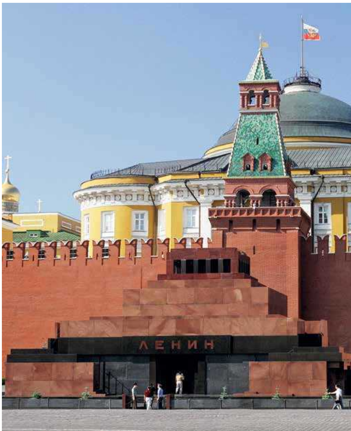
Мавзолей на Красной площади в Москве.

У входа на тропинку прикремлевского кладбища – малочисленная группка людей, в большинстве своем иностранцы. Похоже, что место скорби и поклонения в наше время успело превратиться в музей со своими экспонатами. Вот по ходу тропинки слева – коллективное захоронение жертв вооруженного противостояния в октябре 1917 г.; вот справа прикрепленные к стене стальные дощечки, за которыми замурованы урны с прахом Арманд, Горького, Маяковского и др.; дальше бюсты на высоких постаментах узнаваемых советских деятелей, а на земле, под ногами, их могилы в соответствии с бюстами. Сворачиваем по короткой тропинке к Мавзолею – над головой нависает гранитная ограда трибуны с надписью: «ЛЕНИН». На этой трибуне годами стоял Сталин и его соратники, а потом и прямые наследники. Нырнем в полуоткрытую дверь портала, крутая лестница вниз: в полумраке на высоком черном кубе-постаменте светится хрустальный гроб вождя, увешанный помпезными бронзовыми виньетками, бронзи-