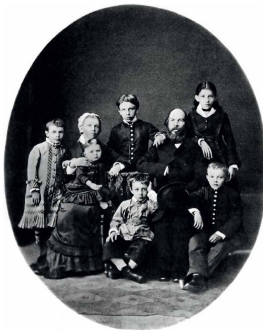
В гимназические годы в кругу своей семьи. Симбирск, 1879 г.

В России конца XIX – начала XX века подтверждался приговор, вынесенный великим старцем Львом Толстым: насилие порождает еще большее насилие. И вопреки мнению писателя Александра Солженицына, что разваливавшее Россию «колесо» было однотонно «красным», на самом деле оно было неравномерно окрашено «красно-белым». До 1917 года белый государственный террор доминировал, но к 1917 году колесо прокрутилось, и красный цвет стал преобладать. Оба «цвета» были в равной степени разрушительными. Только позже, после Октября 1917 года, большевики узурпировали красный цвет и присвоили себе «честь» разрушителей империи. Многочисленное и радикальнее большевиков, более упорно боролись с самодержавием и не только словом, но и оружием, другие революционные партии и в первую очередь наследники народников и учеников Бакунина и Кропоткина: партия социалистов-революционеров и отдельные группы анархистов.