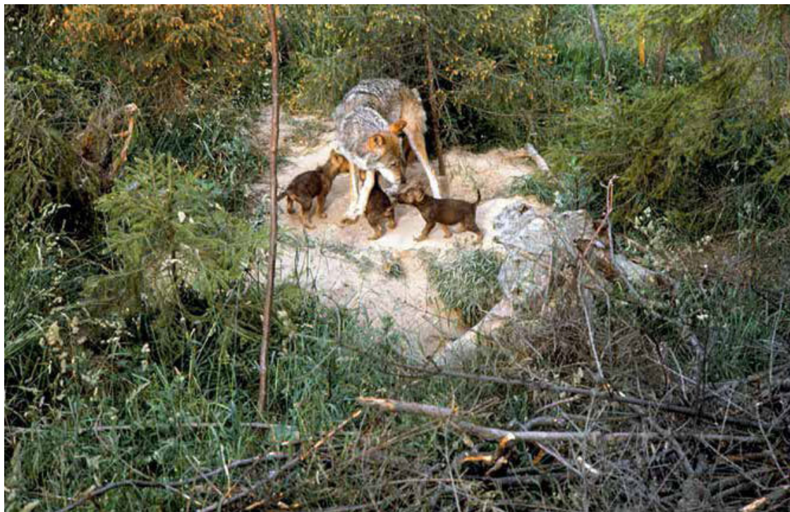
Волчица с волчатами.

У волка нет врагов, кроме человека. Но это враг, выстоять перед которым волку становится все труднее. Картечь, яд, капканы волки знают давно. Теперь же, кроме всего, надо еще бояться автомобиля, самолета, вертолета, моторных саней. Я видел сверху, как волк изнемог и, упав на спину, поднял лапы навстречу нашему вертолету. «От самолета волки прячутся в хлев к овцам, забегают в крестьянские хаты, прыгают в воду», – пишет воздушный охотник. Можно только дивиться, что при такой осаде волки все еще держатся.