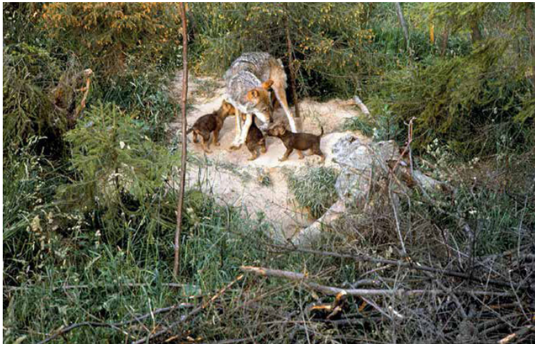
Волчица с волчатами.

К обреченному всегда есть сочувствие. Появилось сочувствие и к волкам. В большой степени этому помогли прекрасные книги канадцев о северном волке и новые взгляды биологов на роль хищника в дикой природе. Доказано: хищник является необходимым звеном в саморегулирующемся механизме природы. Он убивает в первую очередь слабых и этим поддерживает естественный отбор. Стали раздаваться голоса в защиту волков. В областной газете я недавно прочел заметку о том, что волков надо допустить в заповедники: «пусть регулируют жизнь». Заметка вызывает улыбку. Автор ее ужаснулся бы, увидев, что сделает пара волков, например,