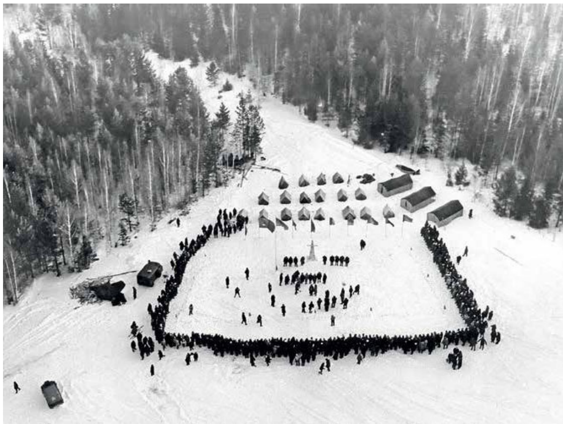
Встреча на границе Европы и Азии.

Все началось с дружеской переписки Москвы и Свердловска: «Давайте встретимся у столба». Встреча была столь веселой и интересной, что вот уже шестнадцатый год подряд в первое воскресенье февраля к столбу, стоящему в сорока километрах от Свердловска, едут туристы. И не только москвичи и уральцы, но и Прибалтика едет, Камчатка, Кавказ, Сыктывкар, Мурманск, Воронеж, Омск, Красноярск, словом, Европа и Азия.