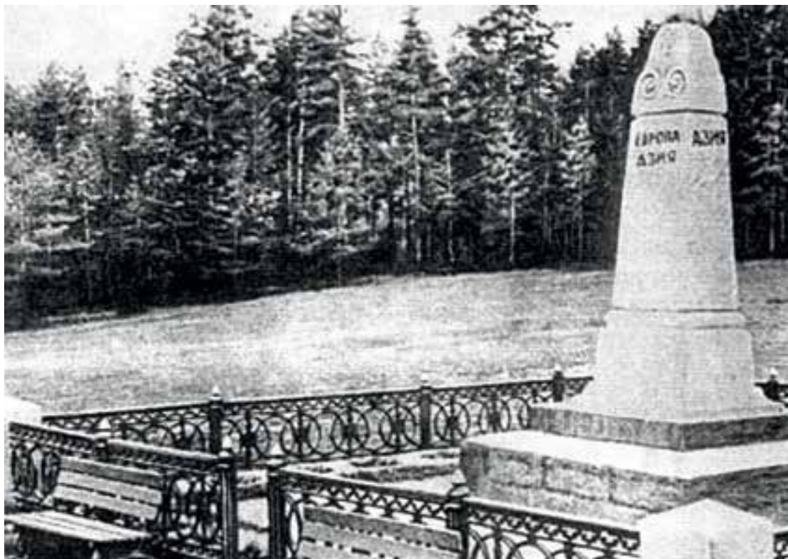
Пограничный столб в сорока километрах от Свердловска.

Около тысячи человек и в этот раз зажигали костер. Я не видел более веселой и оживленной «туристской ярмарки». Обменивались подарками, значками, маршрутными картами. Состязались: кто лучше разберется с картой на местности. Новые песни, новые исполнители и сочинители песен, знакомства, уговоры встретиться там-то и там-то на летних дорогах. И почти каждая из приехавших групп делает зимнее путешествие по Уралу.