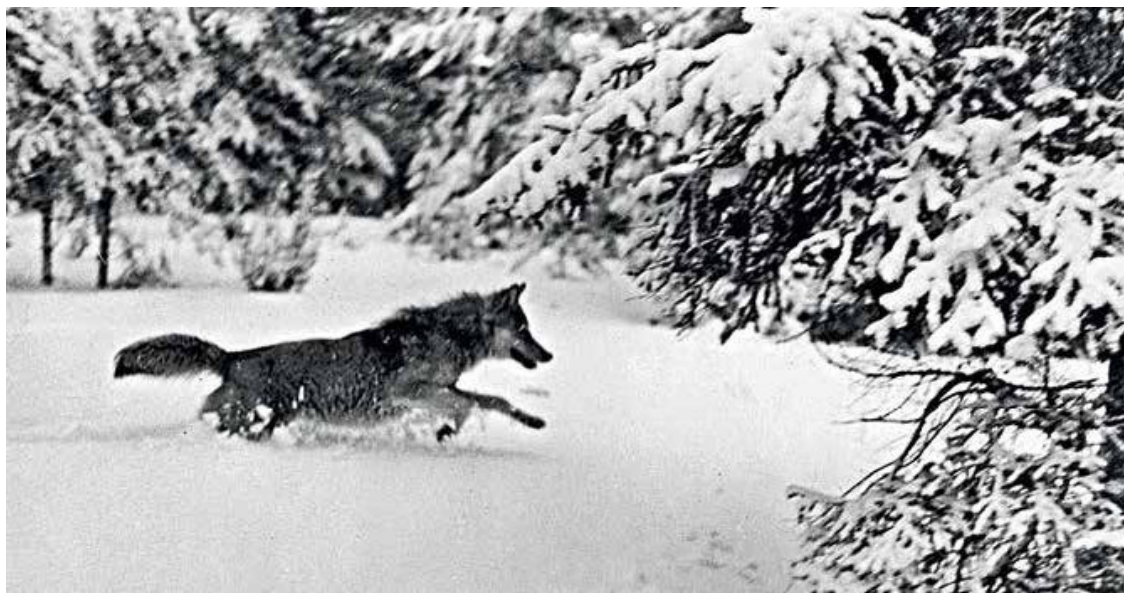
18 февраля 1962 г.