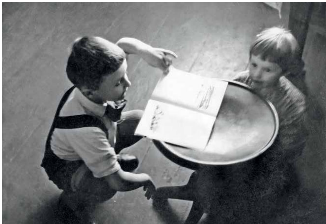
20 января 1962 г.