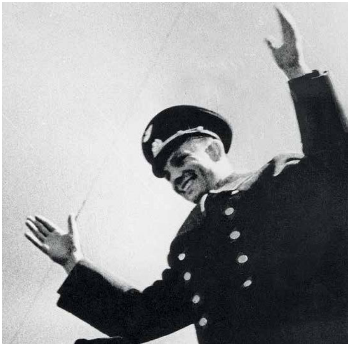
Фото Б. Смирнова. 12 апреля 1962 г.