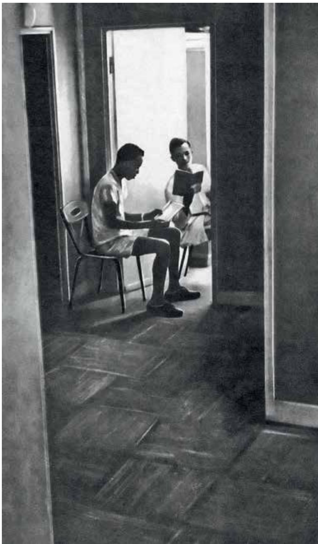
3 февраля 1962 г.