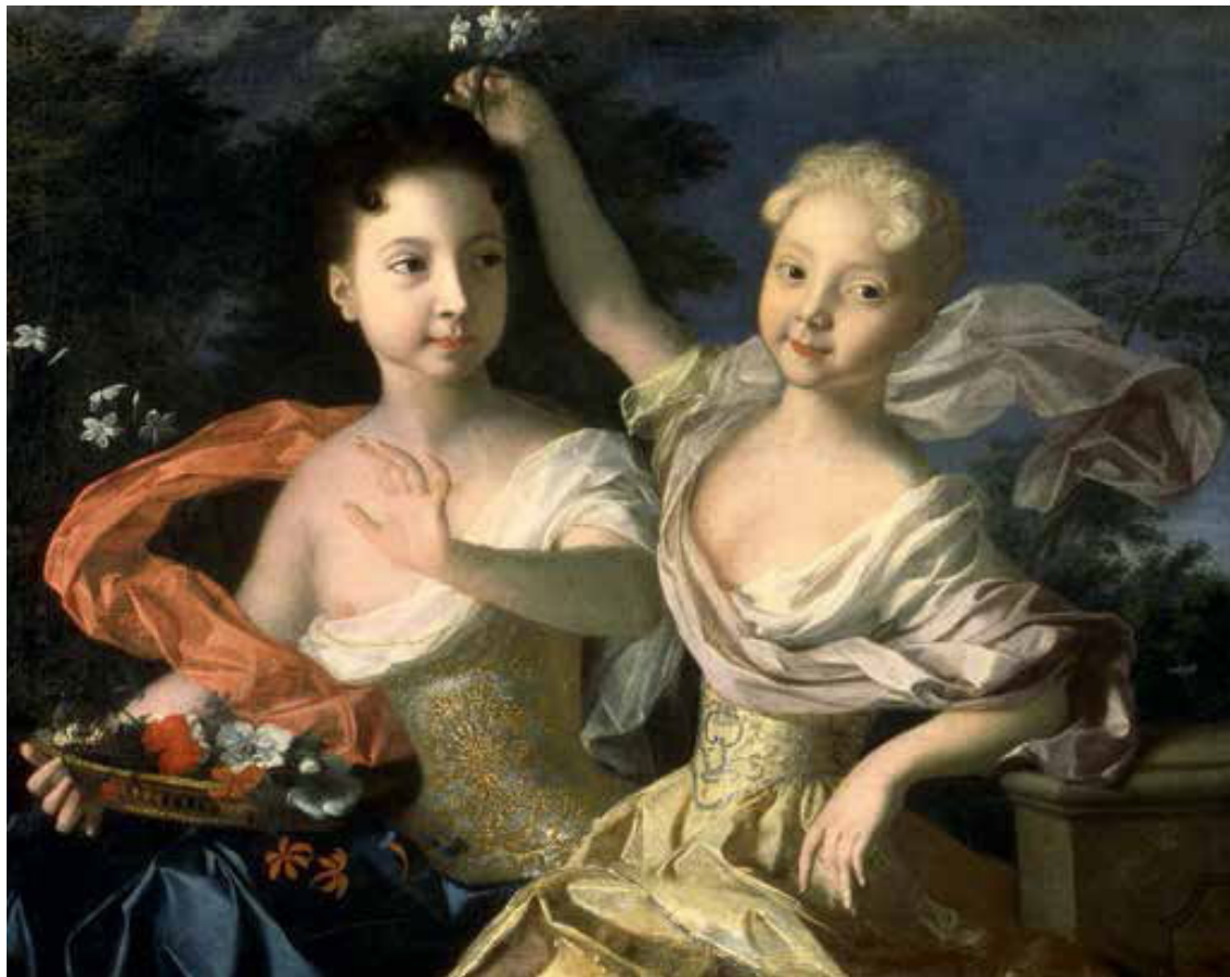
Портрет царевен Анны Петровны и Елизаветы Петровны. Художник Л. Каравак.

Жертвой его гнева пал вероятный любовник – придворный Екатерины Вилим Монс, брат Анны Монс, пассии Петра I времен его молодости. Несчастный Монс был казнен по формальному обвинению в растрате государственных средств. Пётр теперь не торопился с решением вопроса о престолонаследии. А в январе 1725 г. он неожиданно и тяжело заболел и 30 января умер, не успев даже сказать, кто унаследует трон.