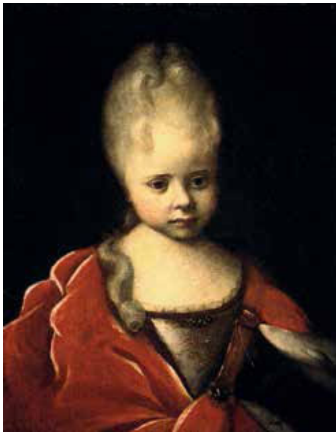
Портрет Елизаветы Петровны в детстве. Художник Л. Каравак.

Судьбу Елизаветы предопределило ее происхождение. Она была царской дочерью, и это, казалось бы, сулило ей с детства радужные перспективы. Однако не все было так однозначно, семейная жизнь ее родителей не могла не отразиться в ее судьбе. Отец Елизаветы царь Пётр I вступил в первый брак в 17-летнем возрасте, еще до начала своих великих дел по преобразованию России. Его супружеская жизнь с царицей Евдокией Фёдоровной, урожденной Лопухиной, сразу не заладилась. Пётр I расстался с женой, принудив ее удалиться в Покровский монастырь в Суздале. От этого брака остался сын Алексей, который значился наследником трона. Он рос под присмотром воспитателей. Отец не мог, а может быть, и не слишком желал уделять ему много внимания. Алексей вырос, женился на немецкой принцессе, у него родились сын Пётр и дочь Наталья. Однако Пётр I чувствовал, что сын по своему характеру и воспитанию не может достойно продолжить его дело. Отношения между ними ухудшились, Алексей бежал за границу, но будучи возвращенным на родину, был подвергнут суду за государственную измену и погиб в заточении.