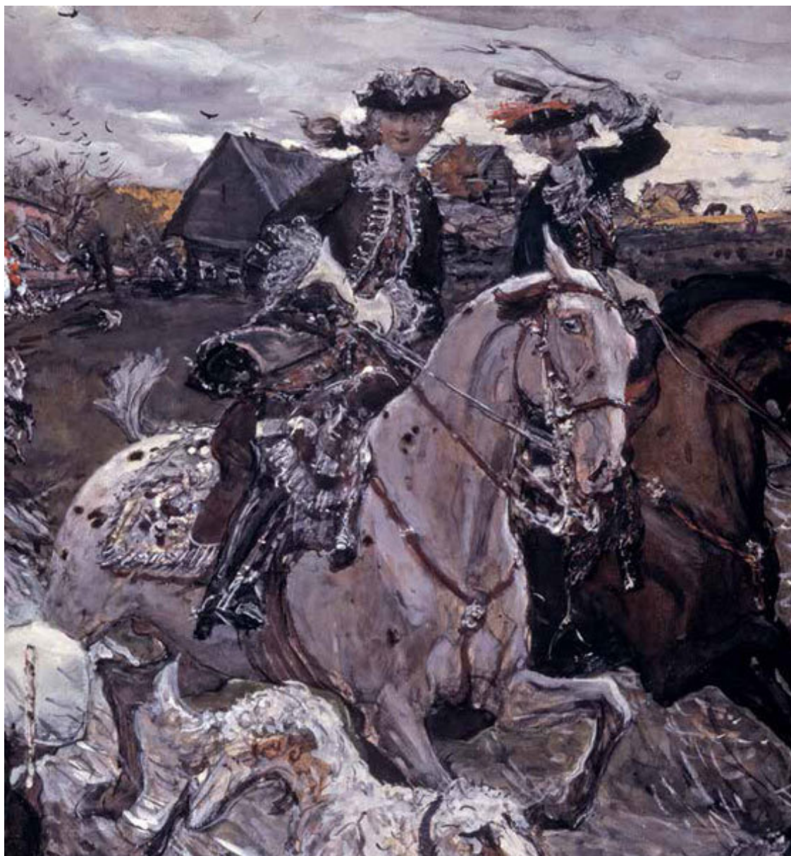
Царевна Елизавета Петровна и Петр II на псовой охоте. Художник В. А. Серов.

князь Иван стал старшим товарищем императора, а дочь княжна Екатерина Алексеевна была объявлена невестой Петра II, состоялось обручение. Елизавета тем временем увлеклась молодым камергером Бутурлиным. Пётр II, узнав об этом, расстроился. Он не явился на именины к цесаревне, а когда из Берлина поступило предложение о браке Елизаветы с маркграфом Бранденбургским Карлом, Пётр II на правах императора отказал. Бутурлин был отправлен служить на Украину.