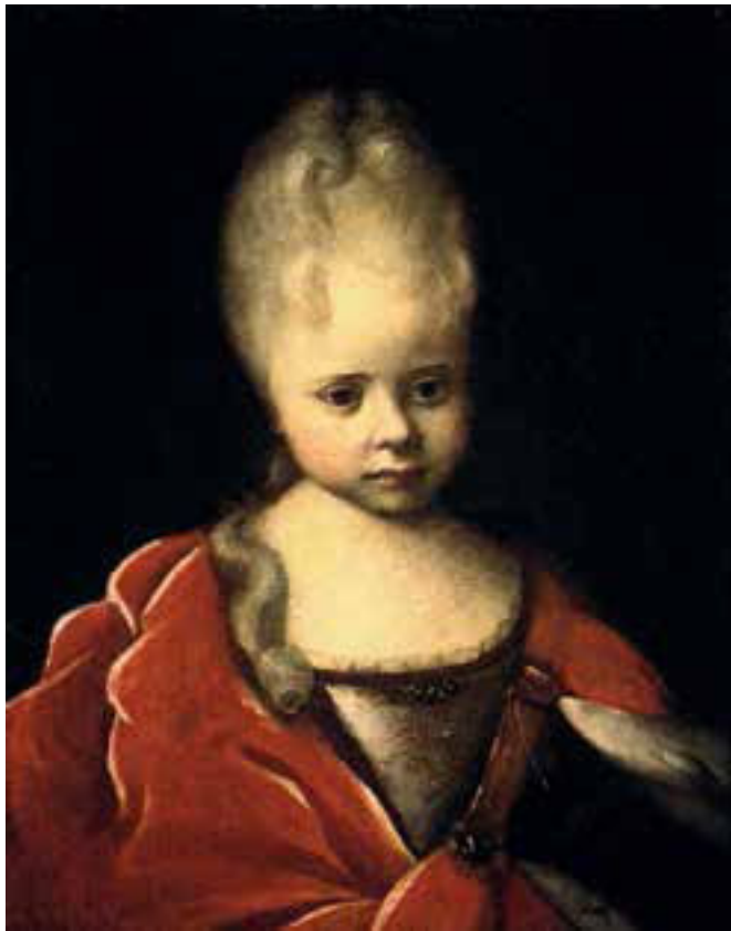
Портрет Елизаветы Петровны в детстве. Художник Л. Каравак.

После расставания с первой женой Пётр I какое-то время увлекался Анной Монс, дочерью трактирщика из Немецкой