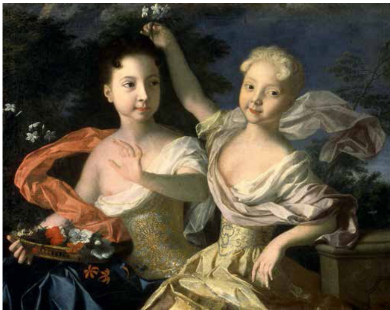
Портрет царевен Анны Петровны и Елизаветы Петровны. Художник Л. Каравак.

ный любовник – придворный Екатерины Вилим Монс, брат Анны Монс, пассии Петра I времен его молодости. Несчастный Монс был казнен по формальному обвинению в растрате государственных средств. Пётр теперь не торопился с решением вопроса о престолонаследии. А в январе 1725 г. он неожиданно и тяжело заболел и 30 января умер, не успев даже сказать, кто унаследует трон.