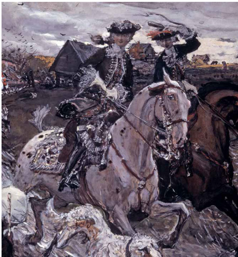
Царевна Елизавета Петровна и Пётр II на псовой охоте. Художник В. А. Серов.

В январе 1730 г. случилась беда. Пётр II заболел оспой, спасти его не смогли, и он умер накануне дня объявлен-