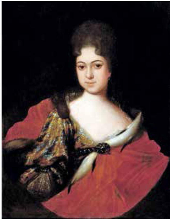
Царевна Прасковья Иоанновна. Художник И. Н. Никитин.

За выполненные требы духовник по традиции получал от царицы драгоценный кубок, 40 соболей, шелковую камку и прочие дары.