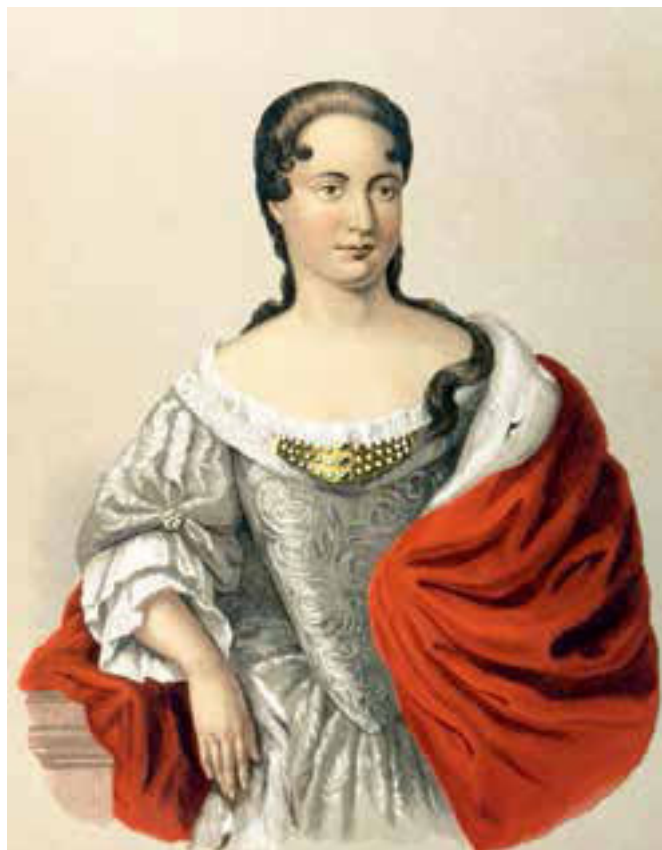
Мать – царица Прасковья Фёдоровна.

25 июня 1682 года сводные братья вместе венчались на русский престол. Так появилось соправление царей Ивана и Петра Алексеевичей. Третьим правителем-регентом была сама Софья, сошедшая с политической сцены в 1689 году. Впрочем, еще до своего заточения в Новодевичьем монастыре властная царевна успела женить брата, который сам «склонности к браку не оказывал».