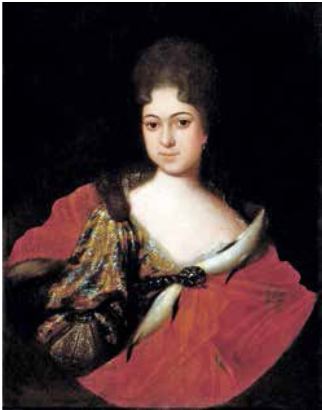
Царевна Прасковья Иоанновна. Художник И. Н. Никитин.

Следующим этикетным шагом были смотрины. Младенца выносили в соседнюю богато убранную палату, где показывали отцу-царю и другим близким родственникам, боярыням