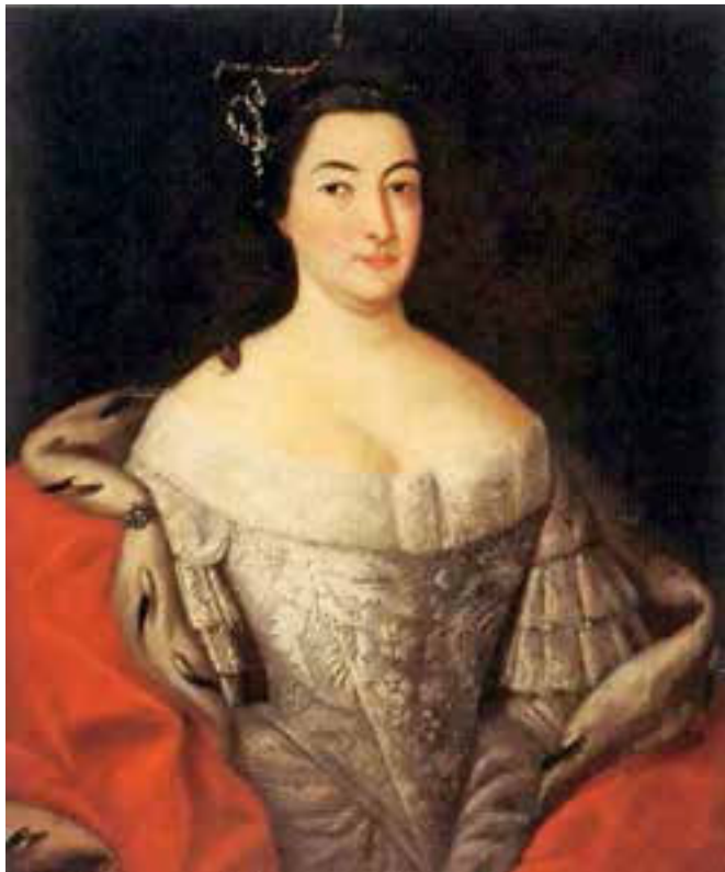
Царевна Екатерина Иоанновна.

Рубеж 1680-х – 1690-х годов, на который пришлось рождение детей у братьев-соправителей, стало последним периодом, когда при появлении царских отпрысков соблюдались многочисленные обычаи московского двора. Осведом-