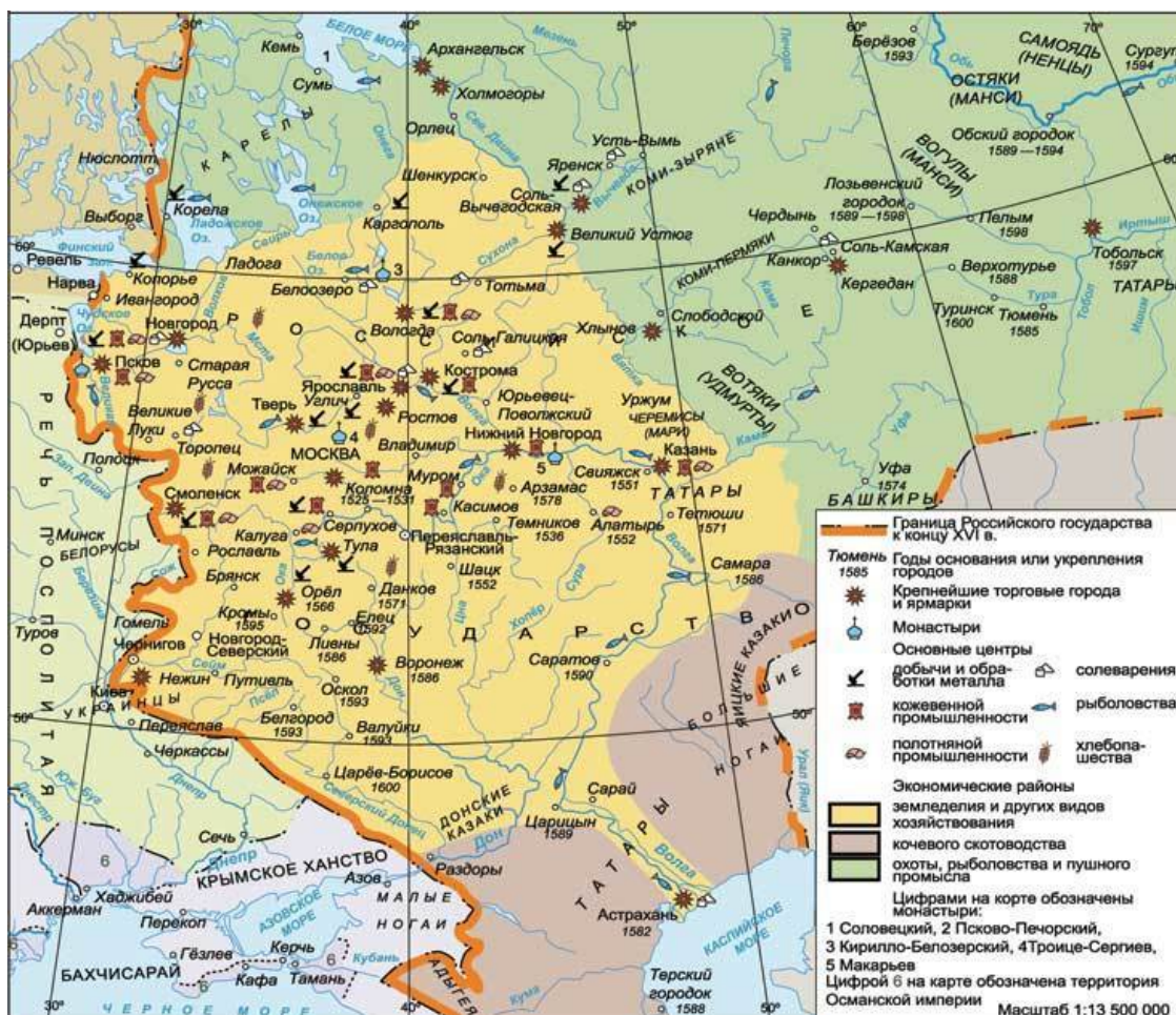
Российское государство в конце XVI в.

убрана. И звали ее тогда не инокиней Ольгой. В той, недавней, но уже такой далекой мирской жизни звалась она царевной Ксенией Борисовной Годуновой.