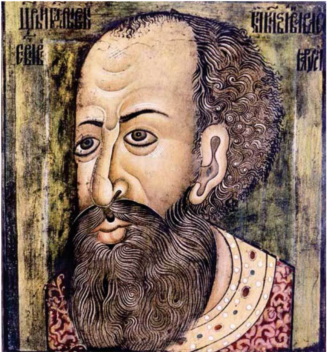
«Копенгагенский портрет» Ивана Грозного, XVI век

Персона царя Ивана Васильевича вызывала пристальный интерес потомков давно.