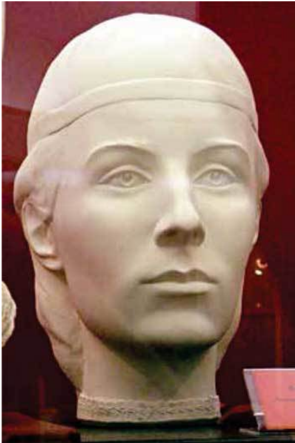
Елена Глинская, мать Ивана Грозного. Реконструкция облика по черепу

Фигура Ивана Грозного осталась одной из знаковых в отечественной культуре XX века. Причем, в духе эпохи, Иван Васильевич шагнул на киноэкраны. В 1935 г. М. А. Булгаков написал сатирическую пьесу «Иван Васильевич», которая при жизни драматурга не была ни напечатана, ни опубликована. Зато гораздо более завидная судьба уготована была дилогии А. Н. Толстого «Иван Грозный», написанной в 1942–1943 гг.: в 1946 г. автор посмертно был удостоен за нее Сталинской премии. Иосифу Виссарионовичу вообще фигура первого русского царя была симпатична (вероятно, ввиду определенных аналогий с собственной персоной). По его инициативе в годы Великой Отечественной войны знаменитый режиссер С. М. Эйзенштейн начал съемки кинокартины, сюжет которой был утвержден лично Сталиным. В 1945 г. фильм вышел на экраны; режиссер и съемочная группа были удостоены Сталинской премии I сте-