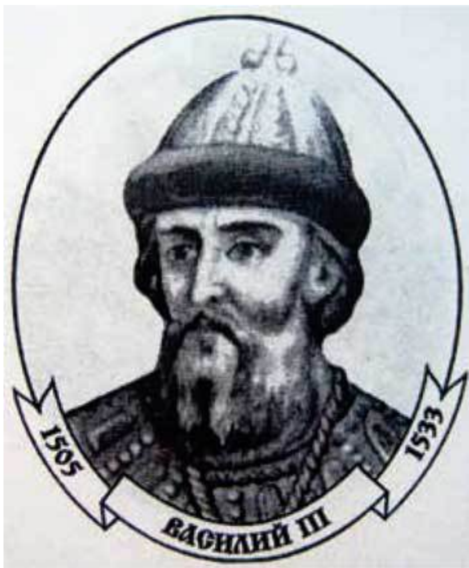
Портрет великого князя московского Василия III, отца Ивана Грозного

Другой столп отечественной исторической науки, С. М. Соловьев, лет через пять после погодинского приговора Ивану Грозному, тринадцатилетним подростком открыл для себя труд Карамзина, и эпоха первого царя сразу привлекла его своей противоречивостью: «Самые любимые томы были: шестой – княжение Иоанна III и восьмой – первая половина царствования Грозного; здесь действовал во мне отроческий патриотизм: любил я особенно времена счастливые, славные для России; взявши, бывало, девятый том, я нехотя читаю первые главы и стремлюсь к любимой странице, где на полях стоит: “Славная осада Пскова”».