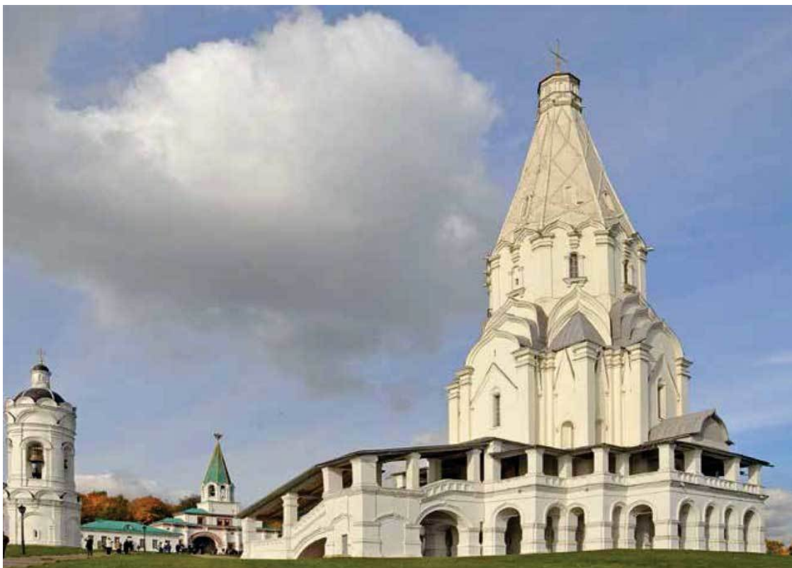
Церковь Вознесения в Коломенском, возведенная в честь рождения Ивана Грозного

пени. Эйзенштейн планировал снять трилогию, но успел создать только вторую часть, которая, в противоположность первой, вождю чрезвычайно не понравилась. Слишком ярко в фильме были показаны пьяные бесчинства царских опричников. В сентябре 1946 г. было опубликовано постановление Оргбюро ЦК ВКП(б), в котором картина была подвергнута уничтожающей критике: «Режиссер С. Эйзенштейн во второй серии фильма «Иван Грозный» обнаружил невежество в изображении исторических фактов, представив прогрессивное войско опричников Ивана Грозного в виде шайки дегенератов... а Ивана Грозного, человека с сильной волей и характером – слабохарактерным и безвольным, чем-то вроде Гамлета». В итоге съемки 3-й части были прекращены, а вторая часть, вызвавшая неудовольствие власти, вышла в прокат лишь в 1958 г., когда ни Сталина, ни Эйзенштейна уже не было в живых. И, наконец, всенародную популярность персоне Ивана Грозного принесла вышедшая на экраны в 1973 г. кинокартина Л. И. Гайдая «Иван Васильевич меняет профессию». В основу сценария была положена пьеса Булгакова, а часть костюмов, использованных при съемках, была сшита еще для картины Эйзенштейна.