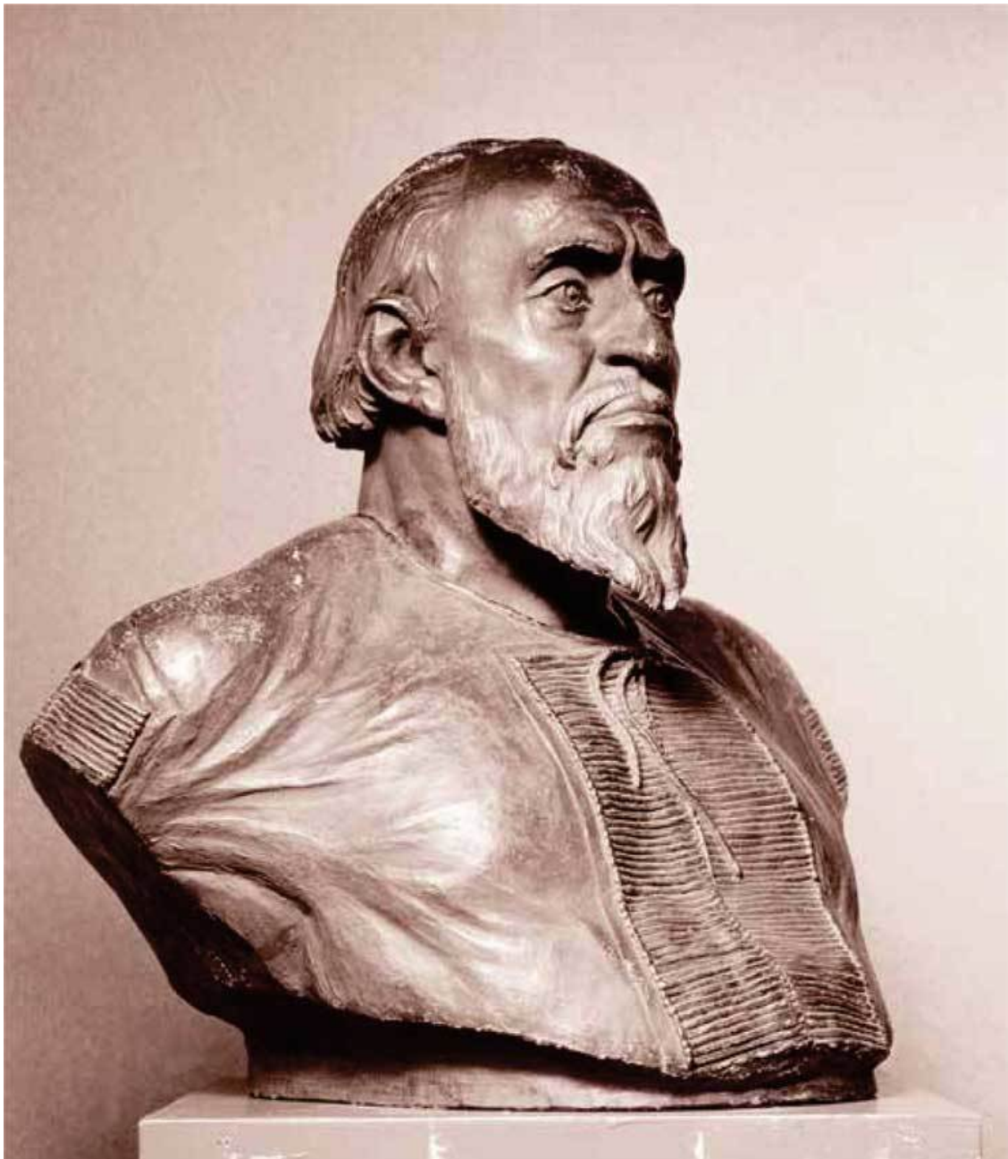
Скульптурный портрет – реконструкция по черепу Ивана Грозного. Скульптор-антрополог М. М. Герасимов

Таковы легенды. Правда же была, как это часто бывает, намного менее красивой и куда как более прозаичной. Отец будущего царя, великий князь московский Василий III Иванович, 46 лет от роду, прожив 20 лет в браке с первой своей супругой, Соломонией Сабуровой, так и не обзавелся наследником. Судьба династии московских Рюриковичей висела на волоске (поскольку младшим своим братьям бездетный великий князь запрещал жениться). Поэтому Василий III задумал развестись с «неплодной» супругой. Впрочем, злые языки утверждали, что развод великого князя был связан не столько с заботами о будущем престола, сколько с тем, что великий князь присмотрел уже себе новую жену – княжну Елену Васильевну Глинскую, которая была примерно на 20 лет моложе Соломонии Сабуровой и лет на 30 младше самого Василия Ивановича.