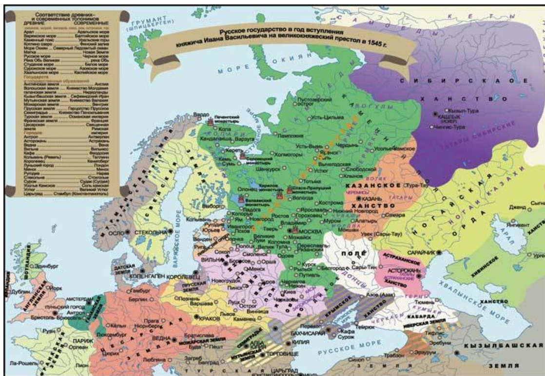
Россия и европейские государства в начале правления Ивана Грозного

Первый император России, Петр I, в конце своего правления, рассуждая об Иване Грозном, заявил: «Сей государь есть мой предшественник и образец; я всегда представлял его себе образцом моего правления в гражданских и воинских делах, но не успел еще в том столь далеко, как он. Глупцы только, коим не известны обстоятельства его времени, свойства его народа и великие его заслуги, называют его мучителем». Как видно, и в начале XVIII в. значение государственной деятельности Ивана IV оценивалось довольно противоречиво. Интересно, что в середине XIX в. почитатели Петра I, «западники», представители общественно-политического и исторического направления в российском либерализме, забывая о словах своего кумира, будут противопоставлять великие свершения Петра Великого деспотическому сумасбродству первого московского царя.