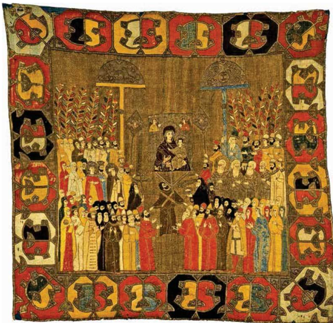
Семья великого князя Ивана III на пелене из мастерской великой Елены Волошанки

Великое княжество Московское и другие русские земли были тогда недостаточно известны в международной политике. Золотая Орда и ее ханы, почтительно именуемые в русских источниках царями, продолжали оказывать колоссальное влияние на политическую жизнь Руси, поскольку именно ордынский правитель давал ярлык на великое княжение, фактически решая, кому достанется пальма первенства среди русских князей. Продолжались и выплаты выхода (дани) татарам, а суверенитет хана считался непоколебимым. До княжения Ивана III осознанного стремления к независимости не прослеживается: все конфликты касались либо отдельных представителей власти Золотой Орды, либо тех, кто узурпировал власть, и их легитимность не признавалась (например, Мамай).