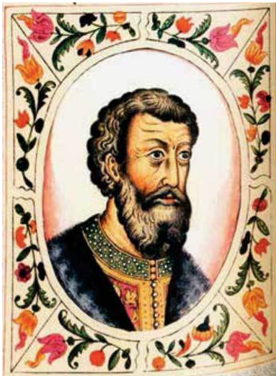
Великий князь Василий II Васильевич Тёмный. Портрет из «Титулярника» 1672 г.

Нельзя обойти стороной и культурную сферу. Московский кремль – один из символов нашей страны во второй половине XV в. получил современный облик, внутри были возведены три собора – Архангельский, Преображенский и Благовещенский. Итальянский зодчий Аристотель Фиораванти и другие иностранные специалисты потрудились над внешним видом царских палат.