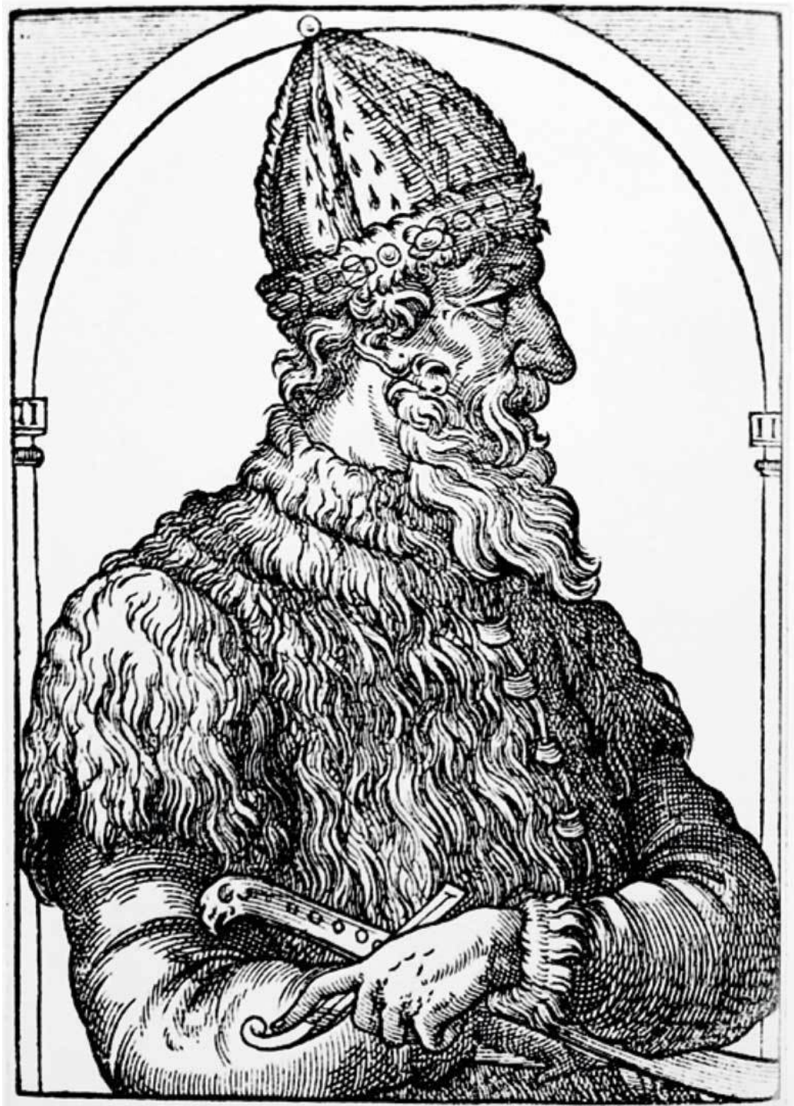
Великий князь Иван III. Гравюра из «Космографии» А. Теве. 1575 г.

В государстве, двигавшемся по пути централизации, появилась новая армия, пришедшая на смену разрозненным дружинам русских княжеств. Иван III и его преемники из военачальников, лично ведущих в бой ратников, становятся главнокомандующими и успешно руководят действиями воевод. Подобная перемена открыла перед великим князем пространство страте-