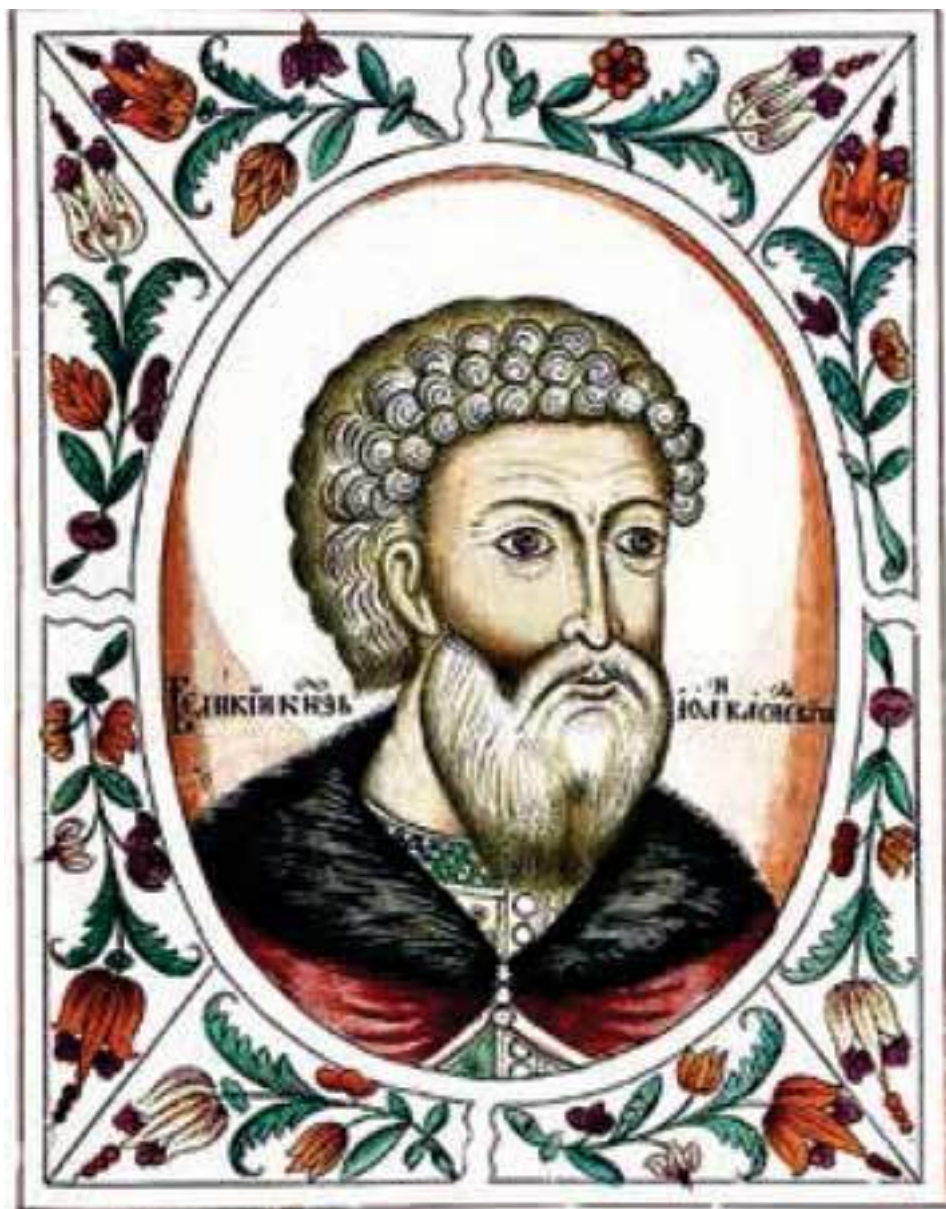
Великий князь Иван III Васильевич. Портрет из «Титулярника» 1672 г.

Отдельную и неоднородную по своему социальному составу группу образовывало духовенство. Его высшие иерархи (митрополит, епископы, игумены и др.), принадлежавшие к числу черного духовенства, принявшего монашеские обеты, располагали значительными земельными владениями, были тесно связаны с представителями московского правящего дома и знатью. Благодаря этому они имели возможность оказывать влияние на внутреннюю политику государства, в том числе и для защиты собственных корпоративных интересов. Белое духовенство (священники) и обычные монахи не обладали значительными привилегиями и по своему экономическому положению недалеко ушли от крестьян и посадских людей.