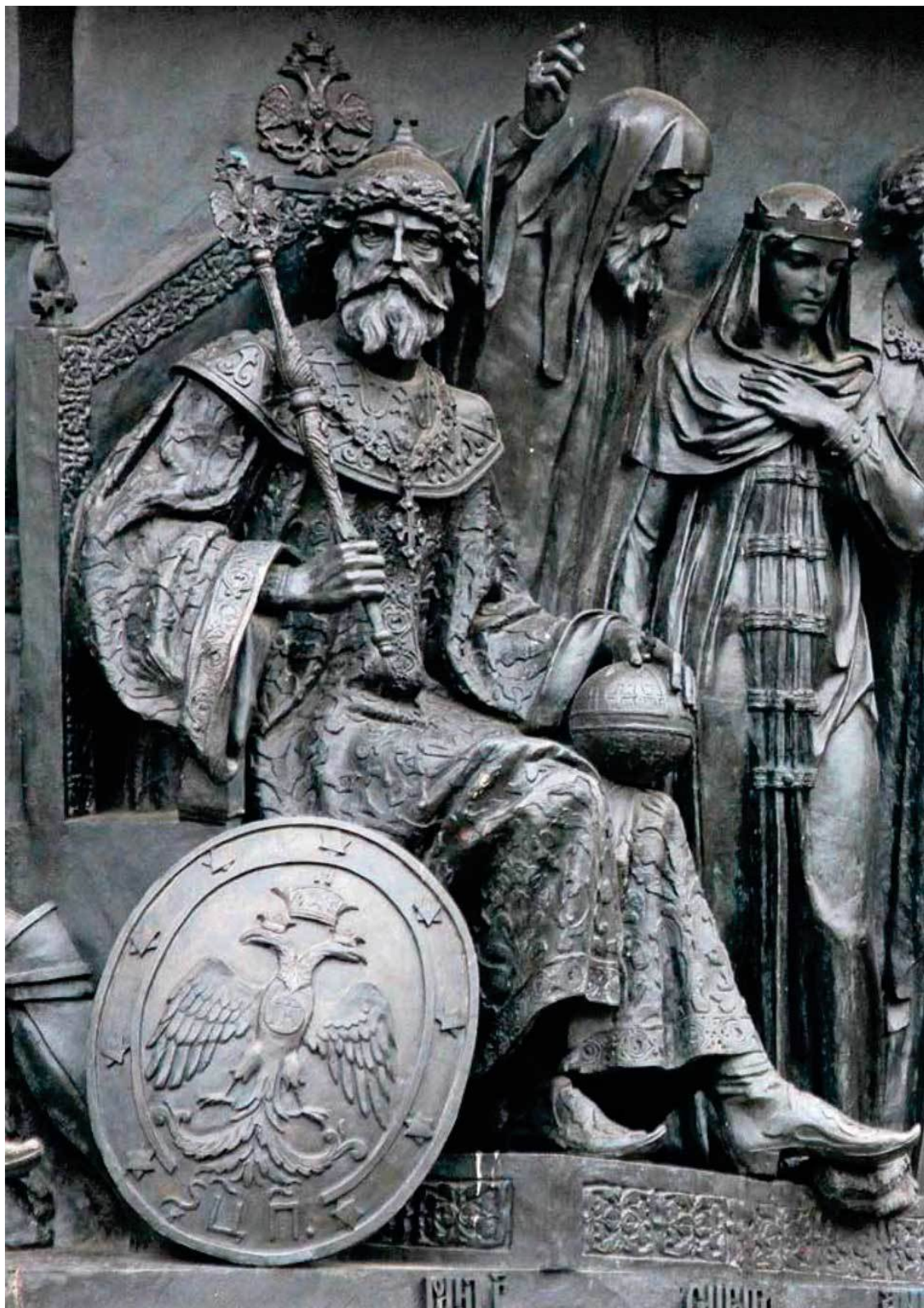
Великий князь Иван III на памятнике «Тысячелетие России». Великий Новгород. Скульптор М. О. Микешин. 1862 г.

Сословные группы, составлявшие русское общество, к тому времени находились в стадии формирования. Ближе всего к великому князю, обладавшему всей властью, были зависимые от Москвы, но еще сохранившие некоторую самостоятельность удельные и служилые князья. За ними шла княжеско-боярская знать, обладавшая правом на занятие важнейших