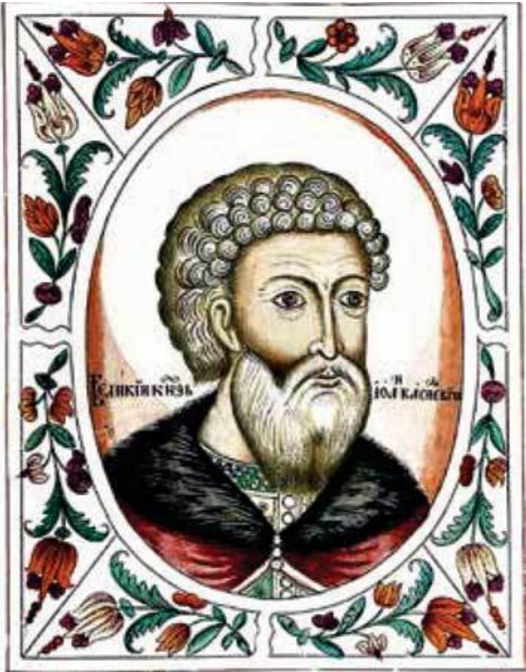
Великий князь Иван III Васильевич. Портрет из «Титулярника» 1672 г.