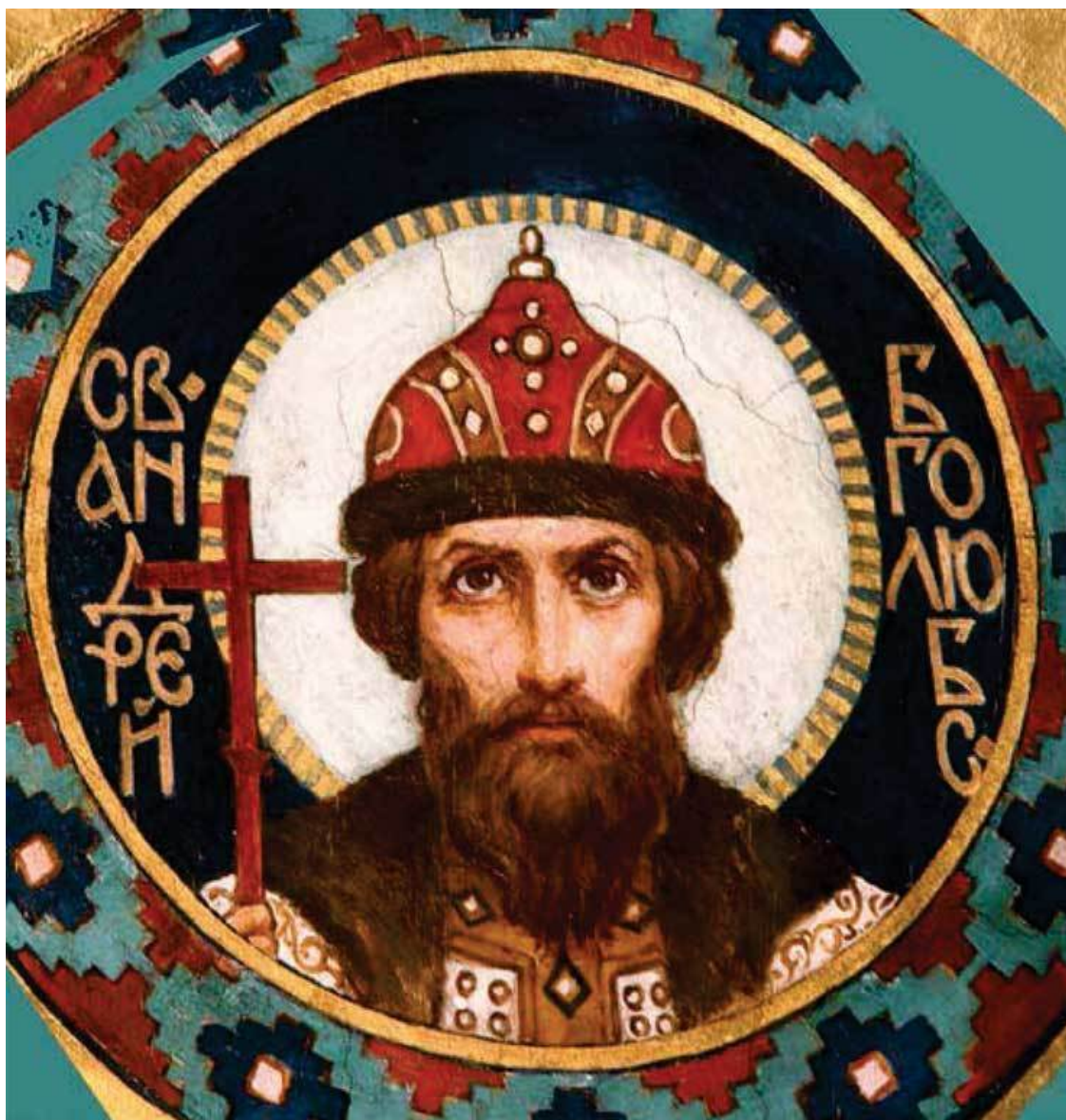
Князь Андрей Боголюбский. Художник В. М. Васнецов

Следующим шагом Юрия по приближению сына к великокняжескому престолу стало «посаждение» Андрея в пригороде Киева Вышгороде, но Андрей не подчинился воле отца и сбежал из города в любимый Владимир, недалеко от которого в скором времени отстроил загородную резиденцию Боголюбово на месте явления ему Богородицы, где и обосновался. С большой пышностью Андрей застроил Владимир, белокаменный храм Успения, построенный в городе, своим убранством не уступал киевской Св. Софии. Столетие спустя именно в этом храме Успения все князья русские, получившие ярлык в Орде на великое княжение Владимирское, проходили процедуру интронизации (религиозный обряд посажения князя на престол). В этот храм из женского Богородичного монастыря в Вышгороде перенес Андрей киевскую реликвию – икону Богородицы, получившую название Владимирской иконы Богоматери и считавшуюся наиболее почитаемой на Руси, написанную самим евангелистом Лукой. Еще в V веке икона была привезена из Иерусалима в Константинополь, а в Киев реликвия попала в качестве дара от Константинопольского Патриарха князю Мстиславу Владимировичу, старшему брату Юрия Владимировича, и затем уже была передана им в Вышгородский монастырь.