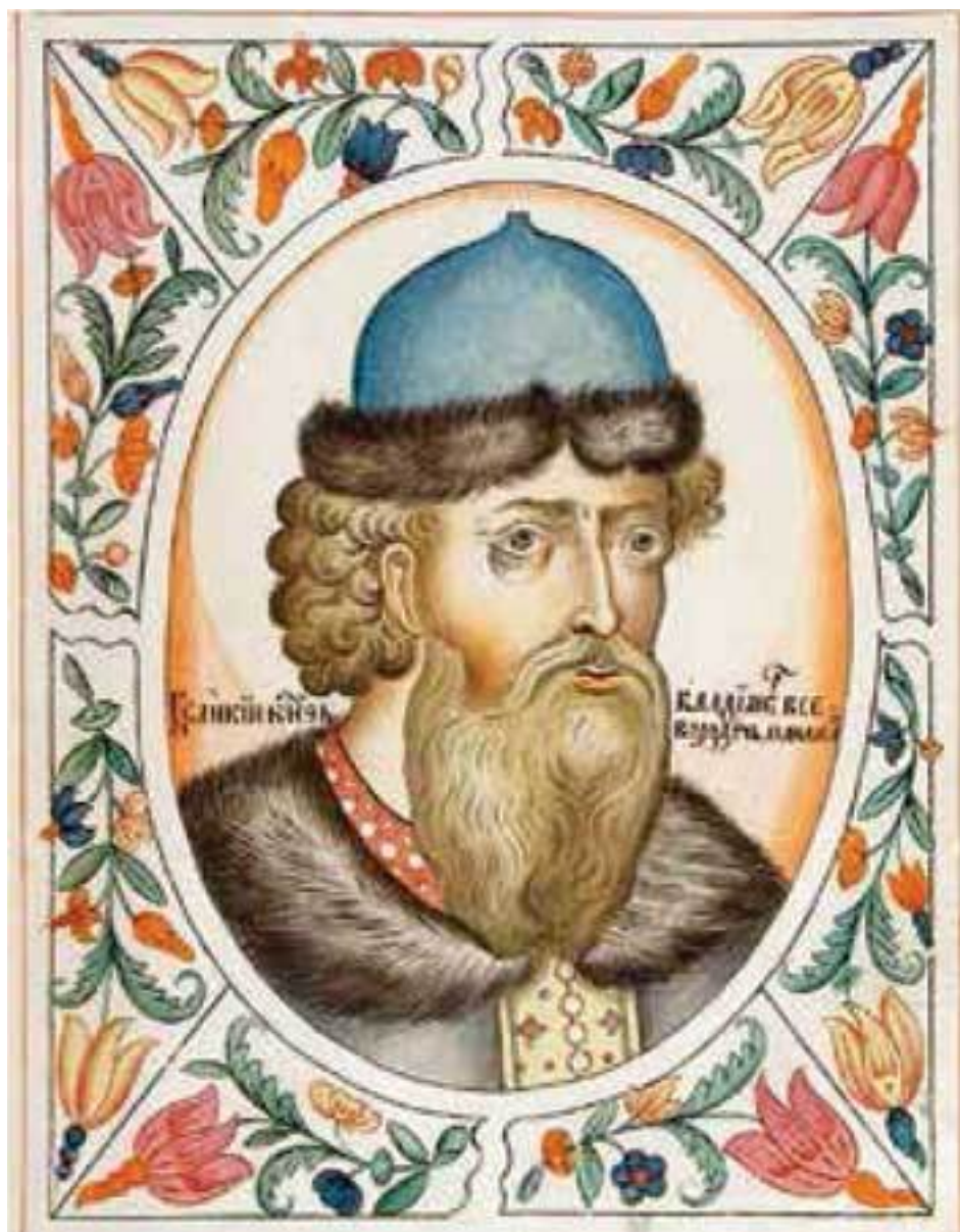
Великий князь Владимир Мономах. Портрет из «Титулярника» 1672 г.

В 1097 году в Любече Владимир Мономах организует княжеский съезд, на котором закрепляется принцип – «каждый держит отчину свою». Реализацией нового принципа междукняжеских отношений стало расчленение территории Древнерусского государства на уделы, закрепленные за потомками Ярослава. Режим Любечского съезда остался как идеальная желаемая схема в среде Мономаховичей (точнее, у Мстиславичей), которые и впредь не будут оставлять надежд возродить политическое наследие деда. Но их усилия останутся безуспешными, поскольку остальные князья будут придерживаться противоположного мнения о Киеве как общединастическом достоянии.