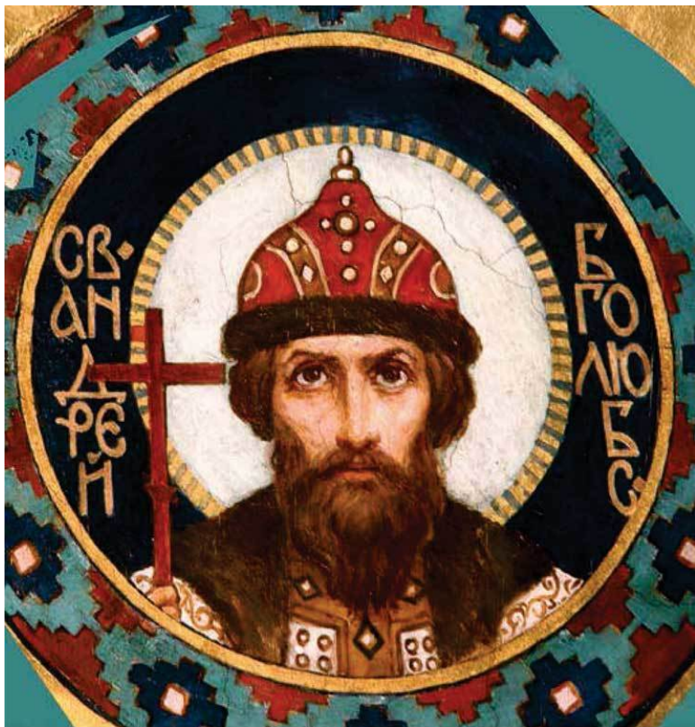
Князь Андрей Боголюбский. Художник В. М. Васнецов

Следующим шагом Юрия по приближению сына к великокняжескому престолу стало «посаждение» Андрея в пригороде Киева Вышгороде, но Андрей не подчинился воле отца и сбежал из города в любимый Владимир, недалеко от ко-