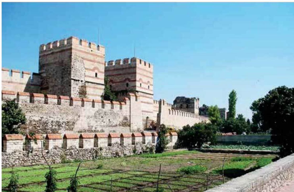
Стены Константинополя. Современный вид

Но Юрий Долгорукий, как уже отмечалось, не слишком дорожил своей «отчиной» и после смерти старших братьев начал стремиться только в Киев на великокняжеский престол. Он не хотел понять, что Киев к середине XII в. уже утратил свое былое значение общерусского центра, что проходящие через него торговые пути в Византию перестали играть для Руси столь большое значение, как раньше, что постоянная угроза половецких набегов осложняла жизнь мирного населения на юго-западе. Особенно опасным было занятие земледелием на окраинах страны. Половцы разоряли все поселения и в массовом порядке уводили крестьян в плен. Поэтому многие сельские жители стремились перебраться на спокойный северо-восток.