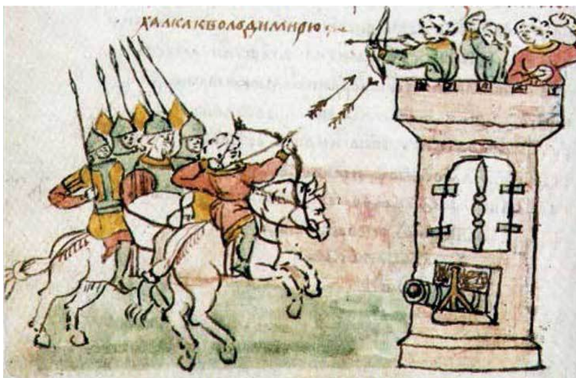
Русское войско. Миниатюра Радзивилловской летописи

При великом князе Юрии Долгоруком (ок. 1090–1157 гг.), отце Всеволода, значение Киева как столицы Древнерусского государства существенно упало. В разросшемся роду князей Рюриковичей появилось много самостоятельных правителей, не желавших подчиняться единому центру и считавших себя независимыми властителями в своих «отчинах» – землях полученных по отцову завещанию.