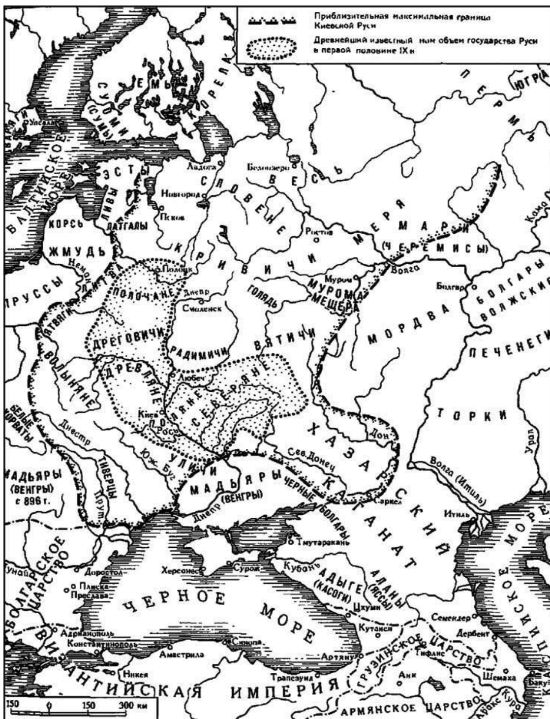
Русь в X в. Схема

На момент выхода замуж обеим княжнам Юрьевнам должно было быть по 15–16 лет. Более ранние браки являлись исключением из правила и заключались по политическим мотивам родителей. Более поздние – были редки, поскольку невесте полагалось родить много детей.