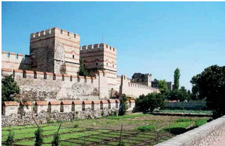
Стены Константинополя. Современный вид

Несмотря на страстную мечту о Киеве, большую часть своей жизни Юрию Владимировичу пришлось провести в Ростово-Суздальском княжестве. Следуя примеру деда и отца, он основал в честь своего имени город Юрьев-Польский, кроме того, построил Звенигород, Коснятин, Кидекшу, Дмитров, перенес на новое место Переславль-Залесский и обнес Москву новыми деревянными стенами.