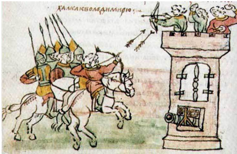
Русское войско. Миниатюра Радзивилловской летописи

К середине XII в. четко выделяются несколько самостоятельных княжеств, претендующих на роль независимых государств: Киевское, Черниговское, Полоцкое, Переяславское, Ростово-Суздальское и Галицко-Волынское. Кроме того, в Древней Руси всегда особняком стояла Новгородская земля. Ее жители сами выбирали себе князя.