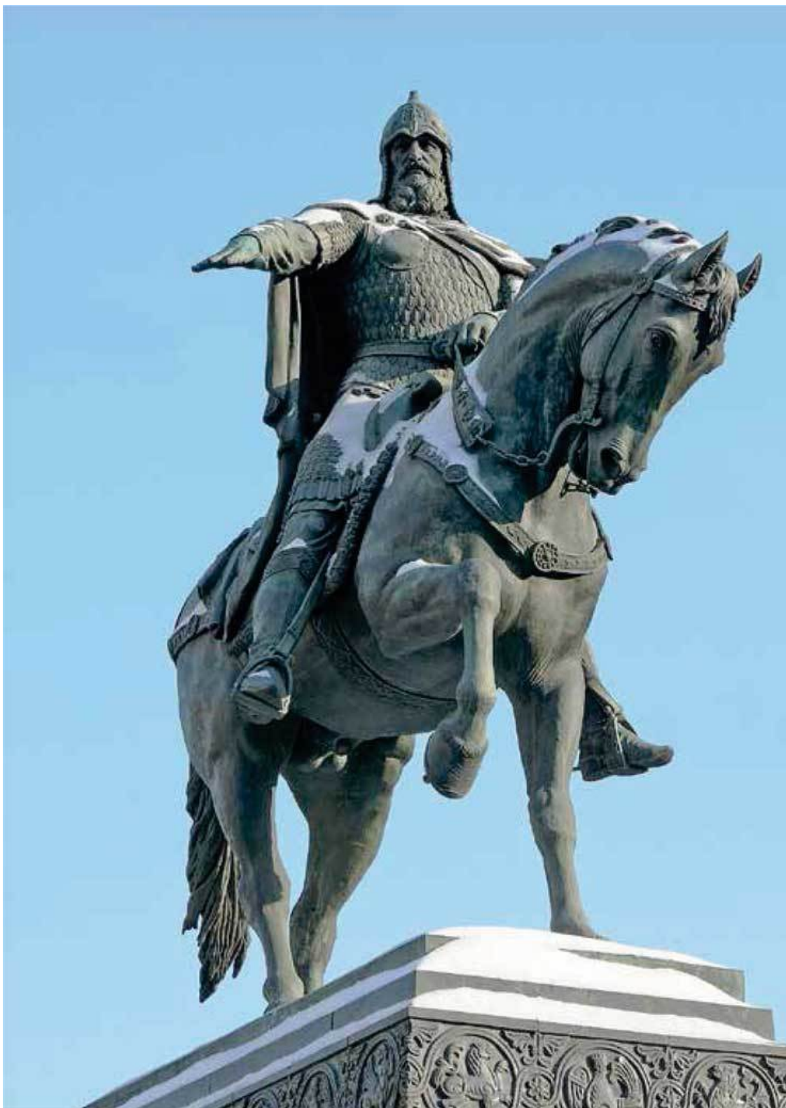
Памятник Юрию Долгорукому в Москве

Но при этом в массовом сознании жителей Древней Руси утративший прежнее значение всеобщей столицы Киев все равно оставался символом верховной власти. Владевший им считался великим князем, старшим среди Рюриковичей, и потому так влек властолюбцев из этого рода киевский «золотой стол».