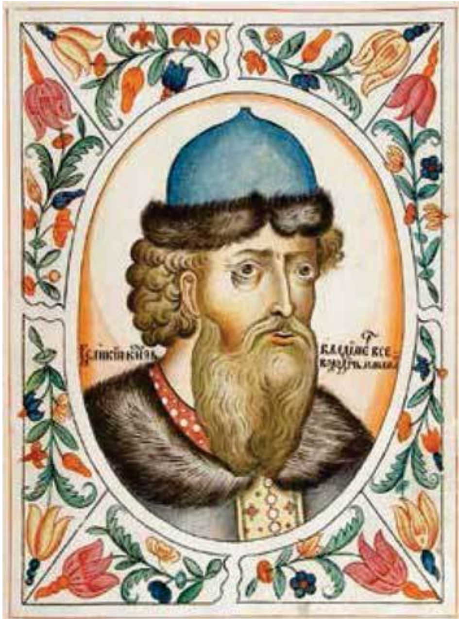
Великий князь Владимир Всеволодович. Портрет из царского титулярника. 1672 г.

Андрей Юрьевич Боголюбский делал то, что искренне считал полезным для Руси.