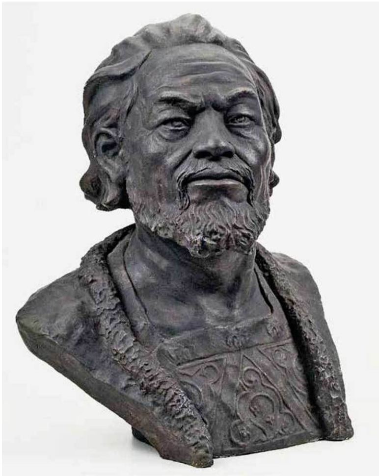
Реконструкция облика князя Андрея Боголюбского, подготовленная М. М. Герасимовым