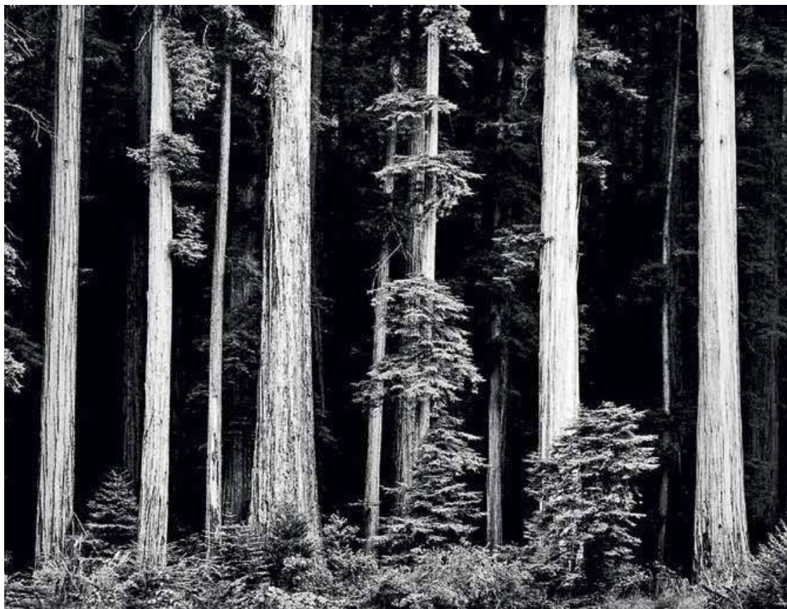
Ансел Адамс. Секвойи.

Не постарели снимки Адамса еще и потому, что он избежал влияния всяческих мод, которым за долгую его жизнь фотография подвергалась. Строгая простота снимков, предельная четкость, вера в магию черно-белых тонов – таковы принципы Адамса. Он не поступился ими ни разу и достиг вершины в искусстве, именуемой классикой.