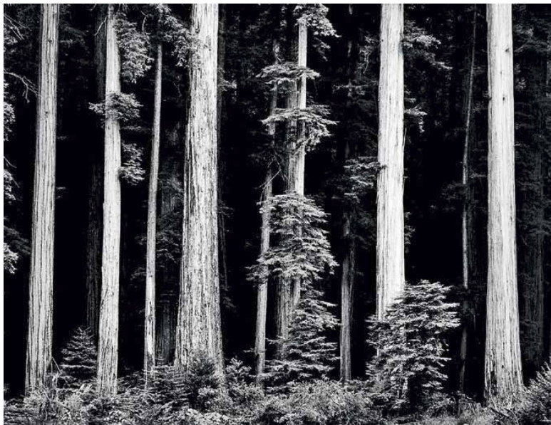
Ансел Адамс. Секвойи.

величия им увиденного. И это волнение передается нам, находит отклик в нашей душе. Искусство это времени не подвластно. С каждым годом нам все дороже будет зелень лесов, молчанье пустынь, плеск чистой воды и сияние неба. И благодарность людям, этот мир для нас открывающим, будет лишь возрастать.