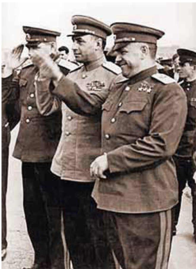
Маршал авиации Ф. Я. Фалалеев, генерал армии А. И. Антонов и маршал Советского Союза Г. К. Жуков.

В марте 1941 г. генерал-майор Антонов получил назначение заместителем начальника штаба Киевского особого военного округа. Именно ему, знатоку боевых действий вермахта, надо было подготовить войска на западной границе СССР для отражения близившейся немецкой агрессии. Однако в полной мере выполнить эту задачу не удалось. К моменту прибытия Антонова в Киев укомплектованность войск КОВО составляла 65–70 %. 24 июня 1941 г. (с выделением из состава округа управления Юго-Западного фронта) генерал Антонов получает назначение на должность начальника штаба Киевского особого военного округа, успешно продолжая начатую им несколько ранее мобилизационную работу. Он же занимался вопросами эвакуации населения и материальных ценностей из прифронтовой полосы, формированием новых военных частей и подразделений. В августе 1941 г. Антонов ведет работу по формированию управления Южного фронта и впоследствии возглавляет его штаб.