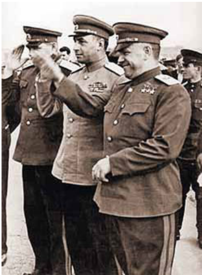
Маршал авиации Ф. Я. Фалалеев, генерал армии А. И. Антонов и маршал Советского Союза Г. К. Жуков.