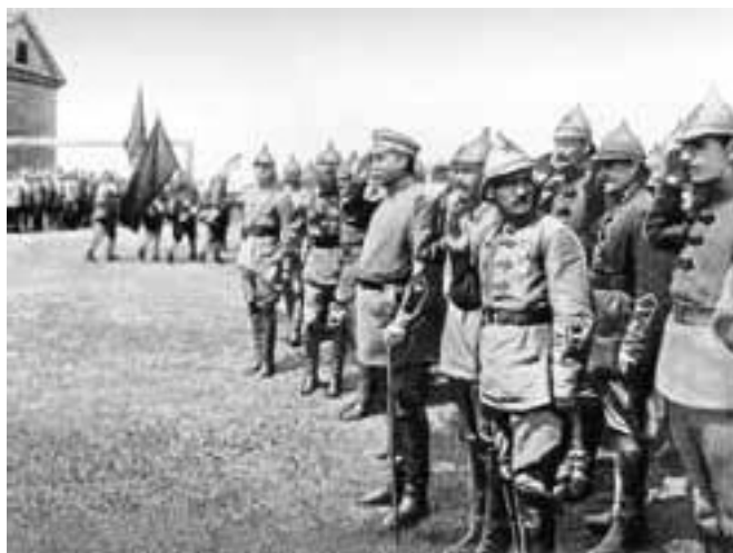
Блюхер и Каменев на параде.

Заметили Каменева и стали выдвигать на крупные посты осенью 1918 г. Именно тогда, в сентябре 1918 г., ему был доверен ключевой в тот период пост командующего Восточным фронтом. Фронт еще продолжал создаваться. Приходилось создавать и штаб фронта, т. к. прежний штаб забрал с собой бывший командующий И. И. Вацетис, ставший главкомом. Борьба с белыми разворачивалась в Поволжье, причем уже в октябре 1918 г. войска фронта отбросили противника от Волги на восток. В конце 1918-го – начале 1919 г. красные овладели Уфой и Оренбургом. Однако в связи с весенним наступлением колчаковских армий эти города пришлось оставить, а фронт вновь откатился в Поволжье.