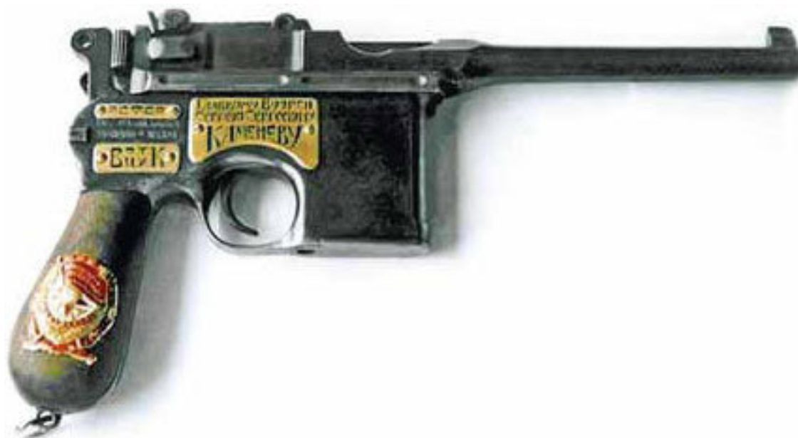
Именной пистолет маузер.

Каменеву выпало руководить борьбой с войсками генерала А. И. Деникина, наступавшими тогда на Москву. Еще на Восточном фронте им был составлен план борьбы с Деникиным, предусматривавший действия по недопущению его соединения с армиями Колчака. К моменту назначения Каменева главкомом такой план уже устарел, так как Колчак был разгромлен, и соединение его с белыми армиями Юга России уже представлялось маловероятным. Тем не менее Каменев проявил большое упорство в отстаивании своего плана, предусматривавшего наступление через Донскую область, где красных ждало наиболее ожесточенное сопротивление антибольшевистски настроенного казачества. План Каменева поддерживал большевистский лидер Ленин, слабо разбиравшийся в стратегических вопросах. В результате красные провалили августовское наступление Южного фронта, а белые вышли на дальние подступы к Москве (дошли до Орла и Мценска, что несло угрозу главному советскому арсеналу – Туле), поставив под угрозу существование Советской России.