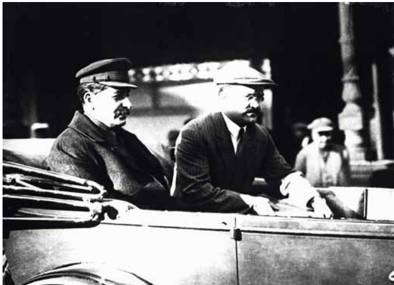
В. М. Молотов и И. В. Сталин едут на V съезд Советов СССР 1929 г.

Накануне Великой Отечественной войны Сталин вынашивал обширные планы по коренному преобразованию и повышению боевой мощи Красной Армии и Военно-морского флота, рассчитанные на несколько лет вперед. «Когда же все это будет нами сделано, – говорил он, – Гитлер не посмеет напасть на Советский Союз». К сожалению, война застала нашу страну и ее Вооруженные силы в стадии реорганизации, перевооружения, переподготовки армии и флота, создания государственных резервов и мобилизационных запа-