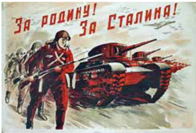
За Родину. Советский плакат 1941 года.

Г. К. Жуков: «И. В. Сталин владел вопросами фронтовых операций и руководил ими с полным знанием дела. Он умел найти главное звено в стратегической обстановке и, ухватившись за него, оказать противодействие врагу, провести ту или иную наступательную операцию. Несомненно, он был достойным Верховным Главнокомандующим. Кроме того, в обеспечении операций, создании стратегических резервов, в организации производства боевой техники и вообще всего необходимого для фронта И. В. Сталин, прямо скажу, проявил себя выдающимся организатором. И будет несправедливо, если мы не отдадим ему за это должное».