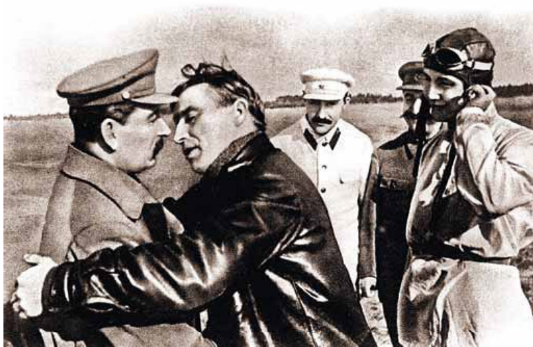
И. В. Сталин встречает экипаж В. П. Чкалова на Щелковском аэродроме.