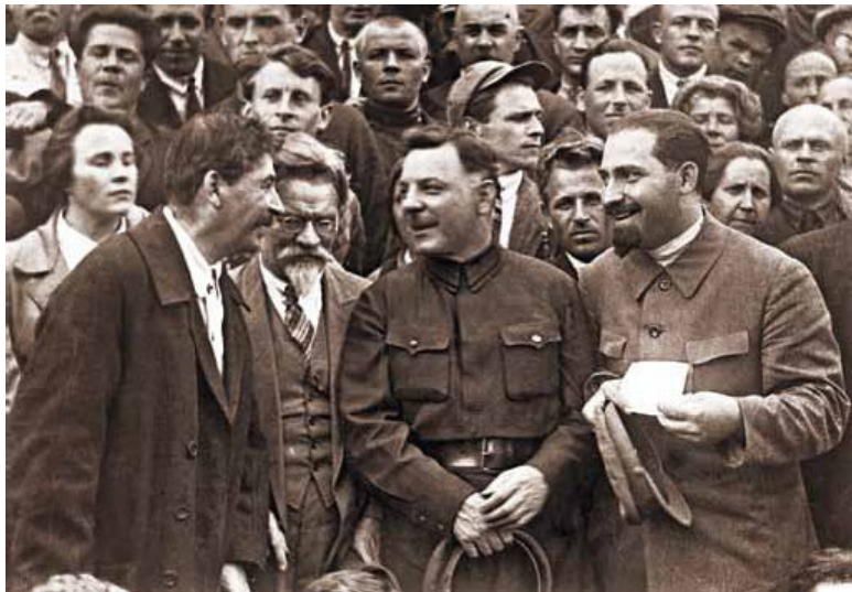
Л. М. Каганович, К. Е. Ворошилов и И. В. Сталин с руководящими работниками Московской организации ВКП (б) 1930 г.