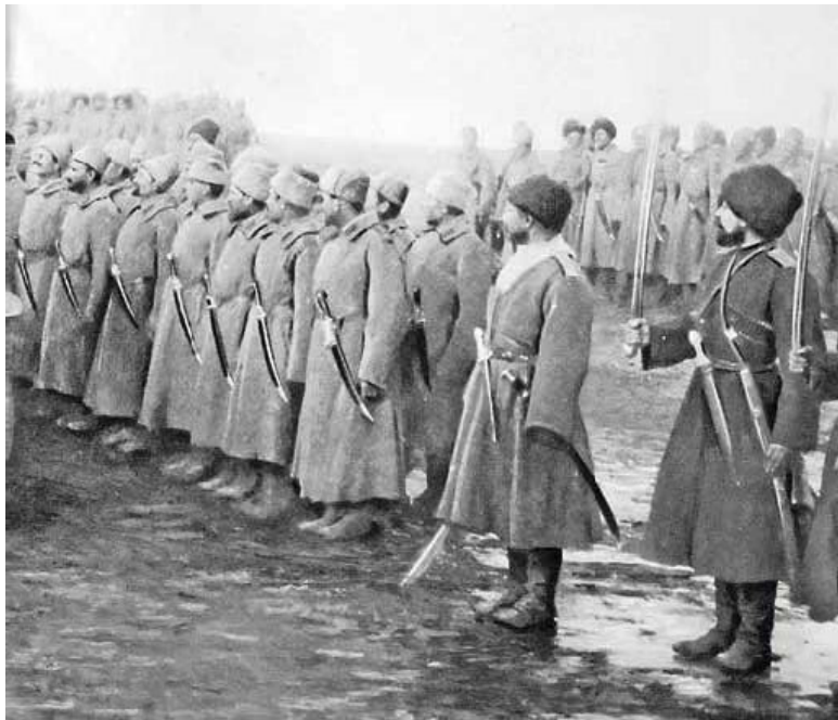
Смотр войск перед Эрзурумским наступлением.

Наступление развернулось в середине января 1916 г. Сначала Юденич нанес отвлекающий удар в Пассинской долине, а затем повел основное наступление на Ольтинском и Эрзурумском направлениях. В прорванный участок фронта оперативно была направлена Сибирская казачья бригада. При этом сам Николай Николаевич успешно маневрировал резервами, наладив жесткое управление войсками и держа си-