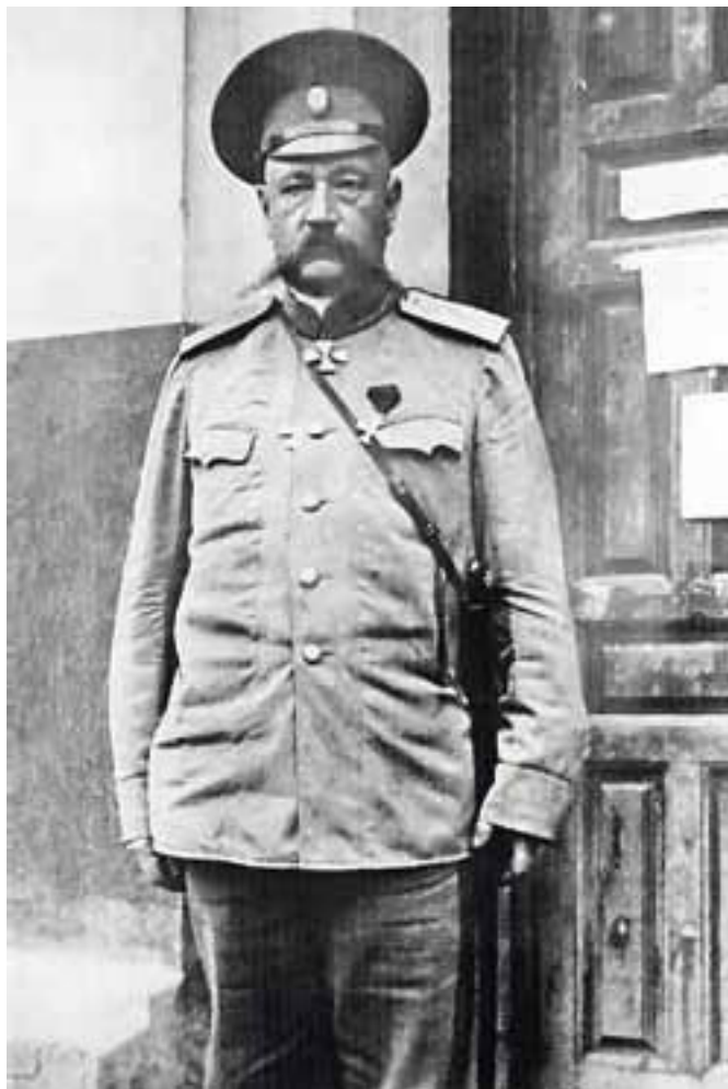
Генерал Н. Н. Юденич. Россия, 1918–1919 гг.