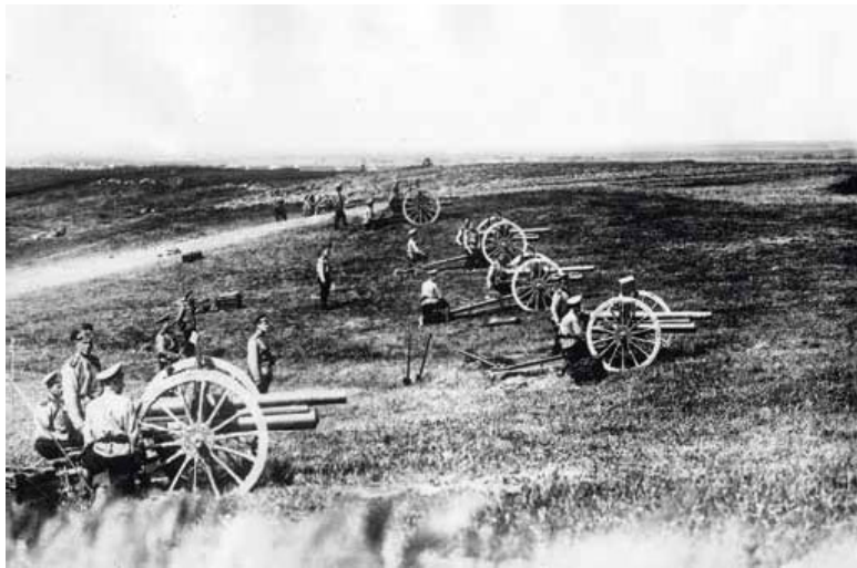
Русская артиллерия на позициях. 1915 г.

Германское же командование в лице Э. Людендорфа, фиксируя «энергичные контратаки» русских и «значительные потери» своих войск, подчеркивало: «Наши войска получили от русских урок». Генерал-квартирмейстер германского Восточного фронта М. Гофман отметил факт охвата с фланга и обхода немцев со стороны русских под Праснышем.