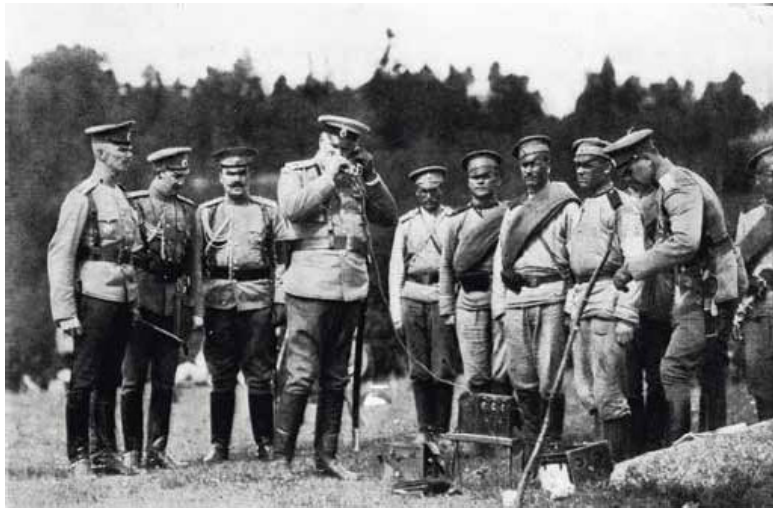
Полевой штаб. Офицеры на связи с комадованием.

Именно после Лодзинской битвы Павел Адамович заслужил славу мастера кризисных ситуаций, о котором вспоминают в тяжелой оперативной обстановке. Директивы генерала пронизаны требованиями «держатъ связь», «энергично атаковать», «активно применять конницу», «энергично наступать», «действовать самым решительным образом». Именно его действиям Лодзь обязана спасением, а ударная группа немцев – котлом. Плевел прекрасно понимал: только нерешительность, неумение ориентироваться в быстро меняющейся обстановке современной войны, невладение ситуацией со стороны командования фронта не позволили так-