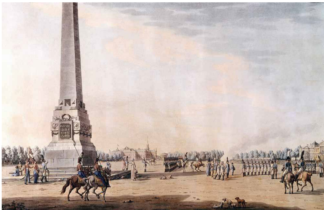
Монумент Румянцеву на набережной Васильевского острова.

Румянцев хотел немедленно двинуться на неприятеля, но не считал возможным сделать это, не имея с собой по крайней мере семидневного провианта. Положение Румянцева было следующее: перед его фронтом стояло 150 000 турок, справа и слева длинные озера Кагул и Ялпуг препятствовали свободному движению, продовольствия оставалось на два – четыре дня. В случае неудачи армия оказалась бы в тяжелом положении, будучи запертой в узком пространстве между рек и больших озер, атакуемая с фронта и с тыла противником в десять раз сильнее. Румянцев мог легко выйти из этого положения, достаточно было только отступить к Фальчи, и, обеспечив себя продовольствием, ждать нападения противника на выбранной позиции. Тогда даже в случае проигрыша сражения он мог отступить на соединение со Второй армией и затем снова перейти в наступление. Но Румянцев остался верным своему правилу: «не сносить присутствия неприятеля, не атаковав его». Румянцев приказал армейским обозам, следовавшим от Фальчи к реке Сальче, перейти к реке Кагул для предотвращения нападения татар из-за Ялпуга.