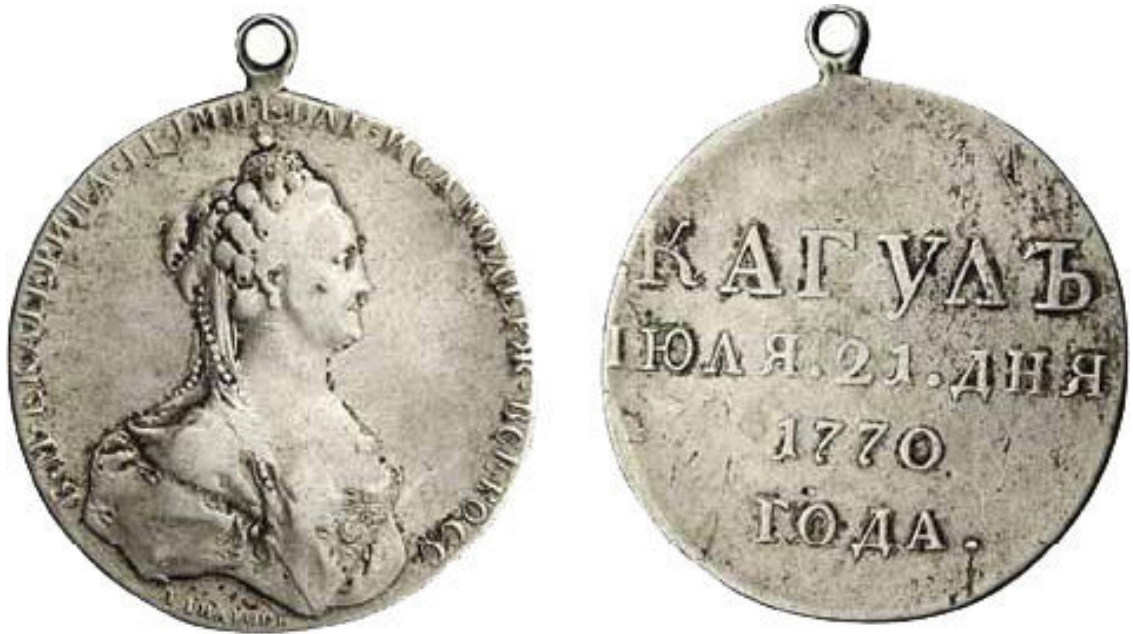
Медаль «За победу при Кагуле».

Иваззаде Халил-паша с саблей в руке пытался остановить бегущих, но все его слова пропадали даром. Объятые паникой османские воины кричали в ответ Иваззаде Халил-паше: «Нет сил сбить русских, которые поражают нас огнем, как молнией». Находившийся позади султанского войска Мустафа-паша рубил отходящим уши и носы, но и это средство не смогло прекратить беспорядочное бегство турок.