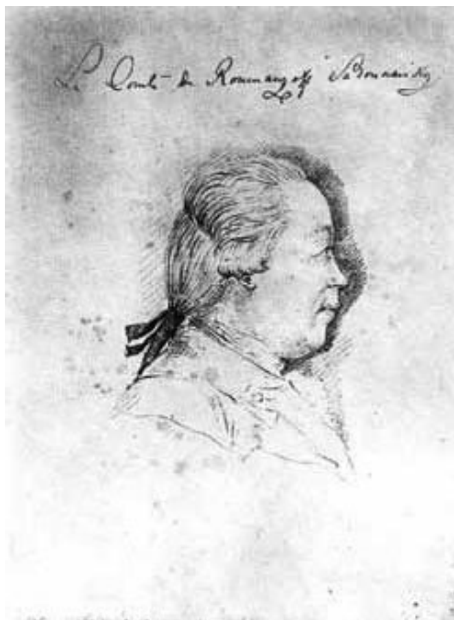
П. А. Румянцев-Задунайский. Художник И.-И. Хааке. Государственная Третьяковская галерея.

Русский полководец уже в 1770 г. выработал правила построения войск для нападения на турецко-татарскую армию. По замыслу Румянцева, каждая дивизия («корпус») строилась в каре, в котором «боковые фасы половину фрунтового фаса имели». Углы каре предписывалось занять гренадерам ближайших к ним полков. Несколько каре образовывали боевую линию, а на флангах располагались егерские каре. Атаку надлежало производить скорым шагом («поспешно») под звуки музыки.