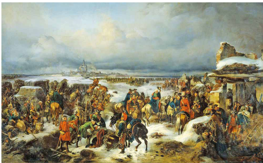
А. Коцебу. Взятие крепости Кольберг 1852 г.

Император очень ценил Петра Александровича, но 28 июня 1762 г. произошел дворцовый переворот, и вскоре свергнутый своей супругой Петр III был убит. Петр Александрович не принимал присяги новой государыне, пока не удостоверился в смерти Петра III. Екатерина с недовольством отнеслась к поступку генерала, но затем, ценя его способности, решила использовать их на благо государства. В 1764 г. Румянцев был назначен генерал-губернатором Малороссии, главным командиром малороссийских казацких полков, запорожских казаков и Украинской дивизии. По поводу Украины императрица тогда сетовала: «От этой плодородной и многолюдной страны Россия не только не имеет доходов, но вынуждена посылать туда ежегодно по 48 тысяч рублей».