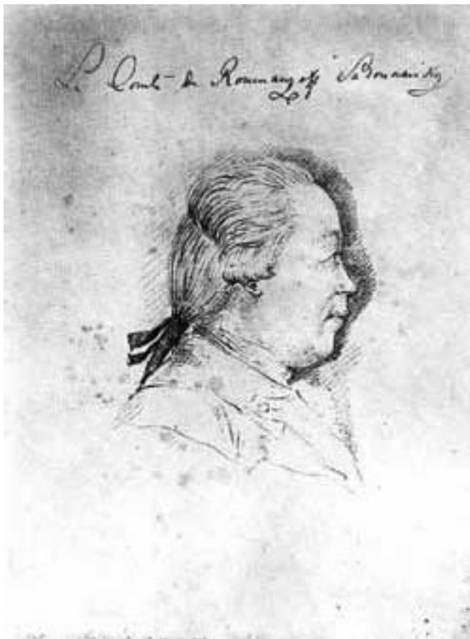
П. А. Румянцев-Задунайский. Художник И.-И. Хааке. Государственная Третьяковская галерея.