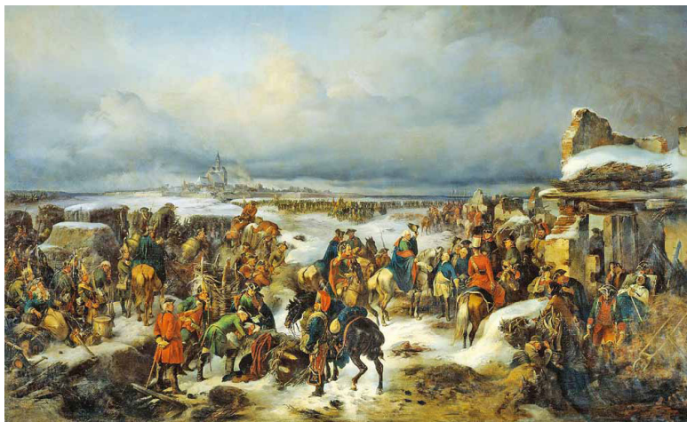
А. Коцебу. Взятие крепости Кольберг 1852 г.

стоверился в смерти Петра III. Екатерина с недовольством отнеслась к поступку генерала, но затем, ценя его способности, решила использовать их на благо государства. В 1764 г. Румянцев был назначен генерал-губернатором Малороссии, главным командиром малороссийских казацких полков, запорожских казаков и Украинской дивизии. По поводу Украины императрица тогда сетовала: «От этой плодородной и многолюдной страны Россия не только не имеет доходов, но вынуждена посылать туда ежегодно по 48 тысяч рублей».