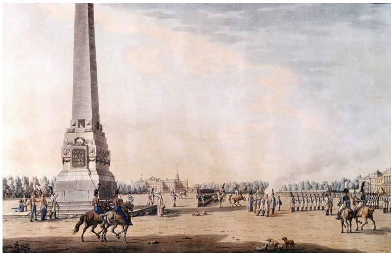
Монумент Румянцеву на набережной Васильевского острова.