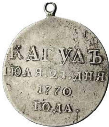
Медаль «За победу при Кагуле».

Иваззаде Халил-паша с саблей в руке пытался остановить