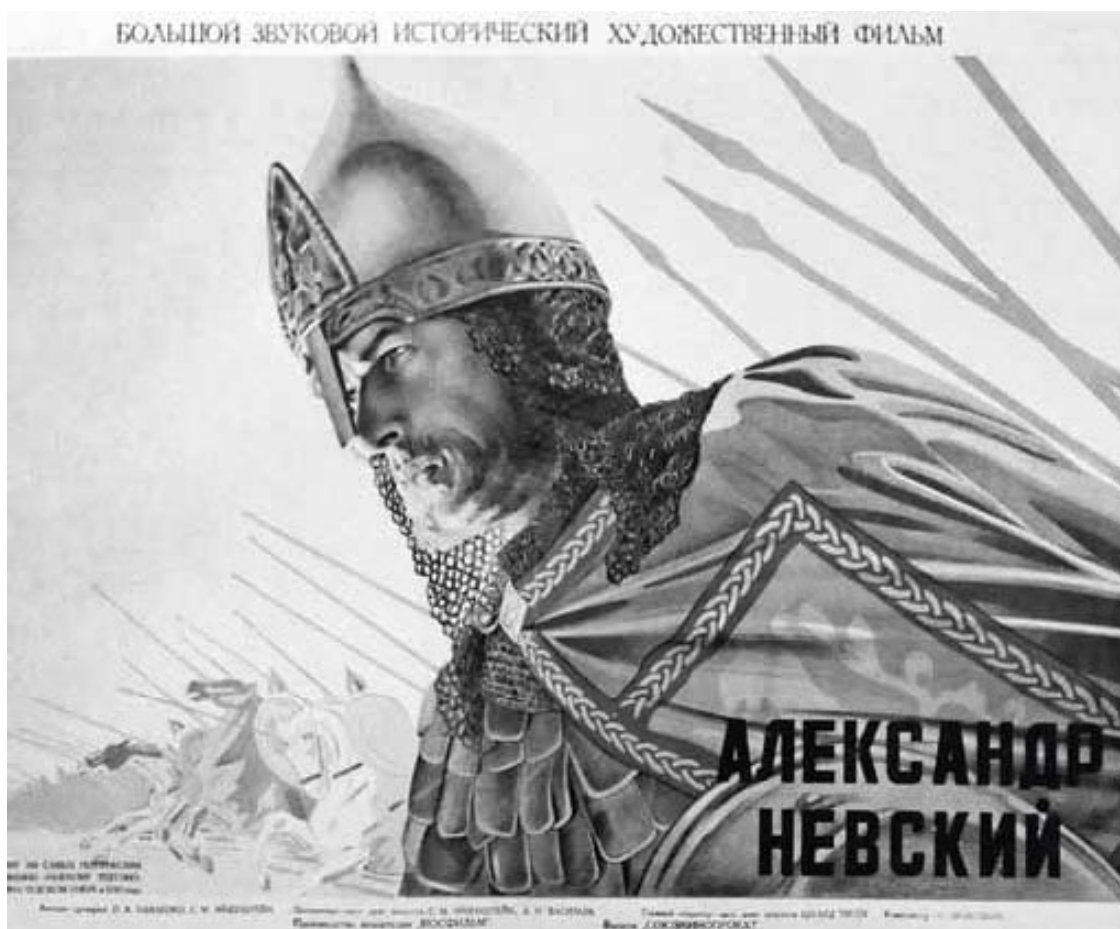
Афиша к фильму С. Эйзенштейна «Александр Невский».

Александр Невский – весьма разноплановый персонаж русской истории. Это и реальный политик XIII в. – князь Александр Ярославич, представитель владимиро-суздальской ветви Рюриковичей-Мономаховичей, который при жизни не носил прозвание Невского. Это и эпический Александр Невский, который в XIV–XVIII вв. постепенно превращался в символ российской национальной и государственной идентичности. Причем образ последнего, эпического Александра Невского в разные эпохи трактовали по-своему, и даже XX столетие сумело внести свой значительный вклад в мифологизацию легендарного двойника князя. (Вспомним прекрасный фильм С. Эйзенштейна «Александр Невский».)