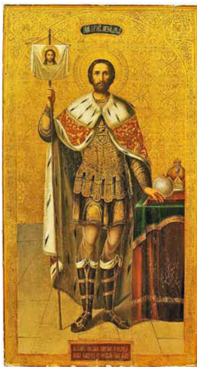
Святой благоверный князь Александр Невский.

Контроль над ресурсами и мощный военный потенциал, включавший кроме больших княжеских дружин еще и многочисленное крестьянское ополчение, позволял владими́ро-суздальским князьям вести активную политику как внутри русского мира, так и за его пределами.