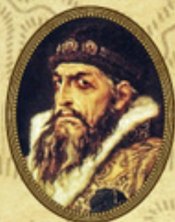
ИВАН IV ГРОЗНЫЙ