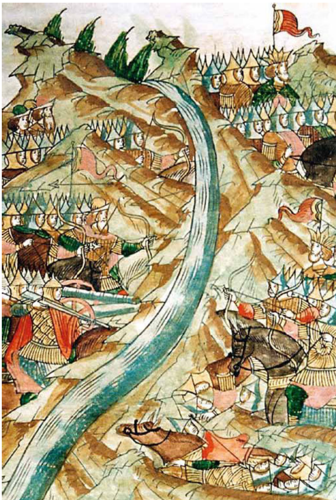
«Стояние на Угре». Миниатюра из Лицевого свода. XVI в.

Ахмат резонно счел, что через Оку ему прорваться не удастся, и повернул на запад, двинувшись к Калуге с целью обхода русских оборонительных позиций. Теперь эпицентр боевых действий сместился на берега реки Угры. Великий князь отправил туда войска, но не остался