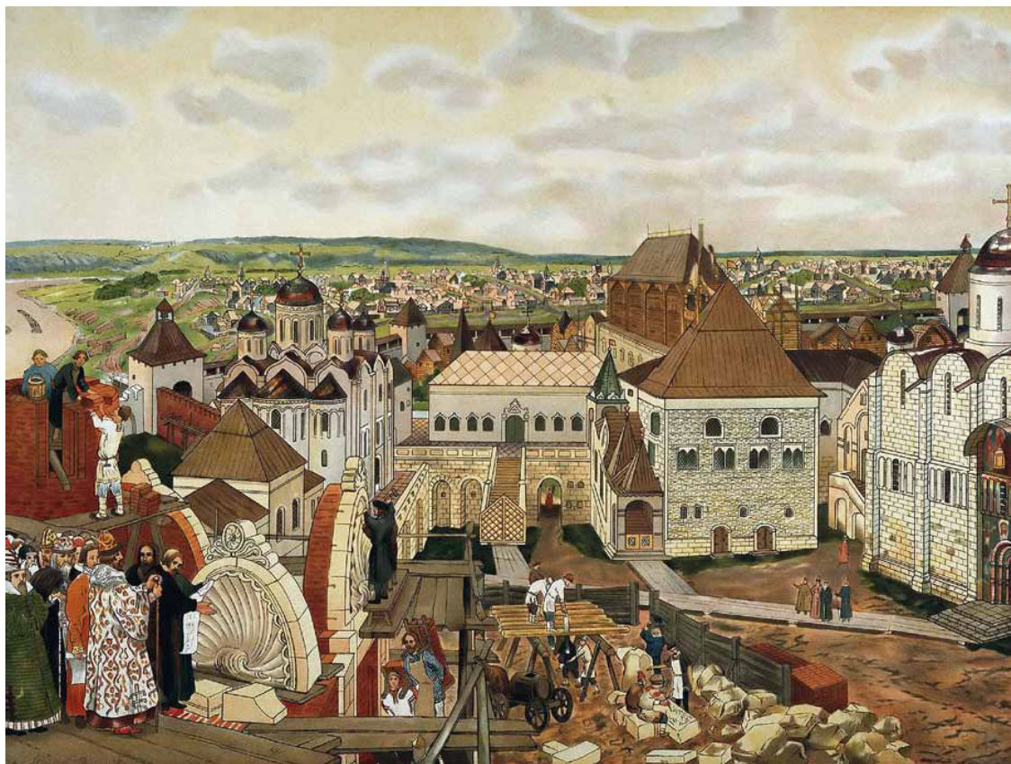
В Московском Кремле. Художник А. Васнецов.