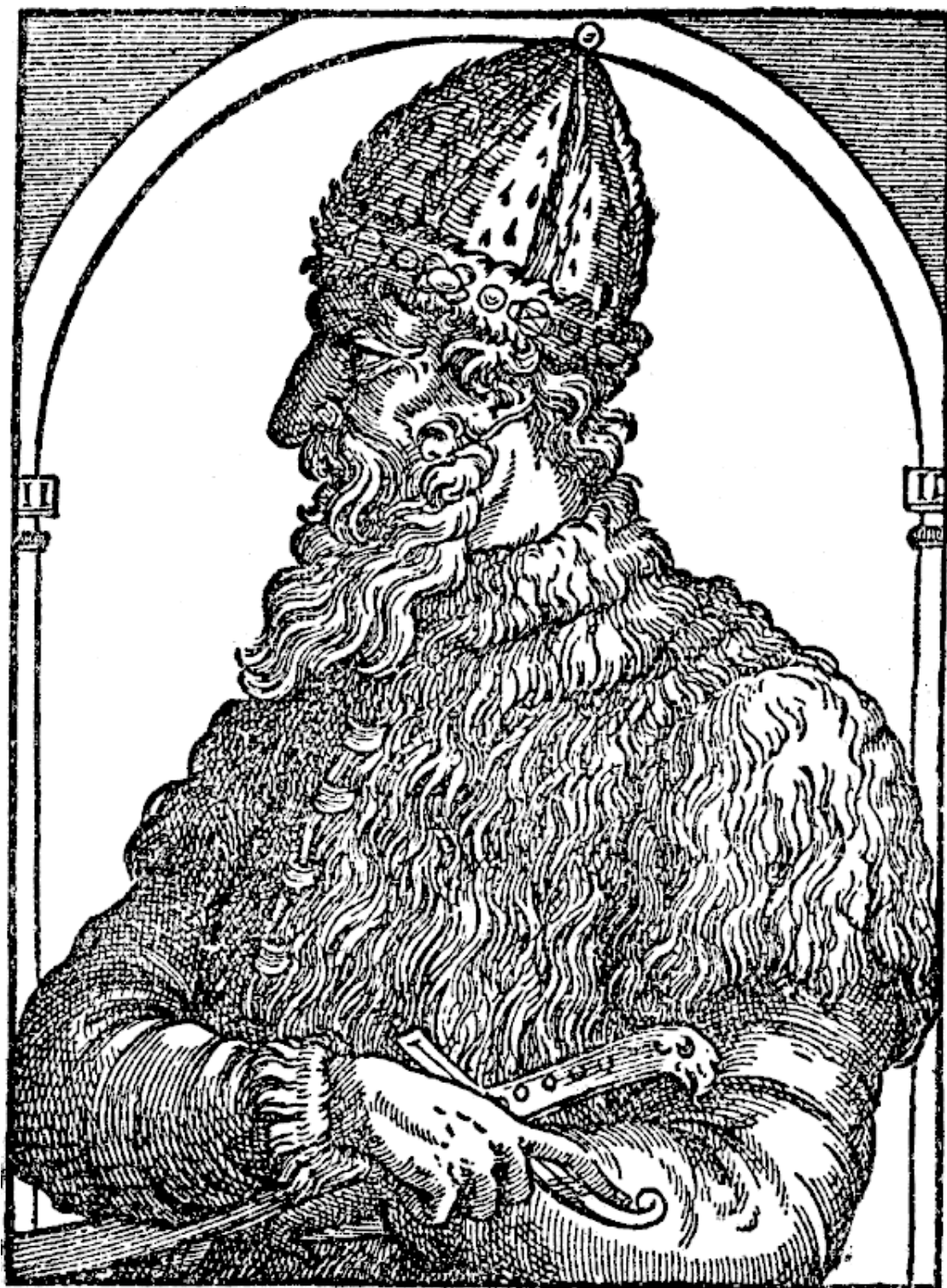
Так представлял себе Ивана III европейский художник XVI в.