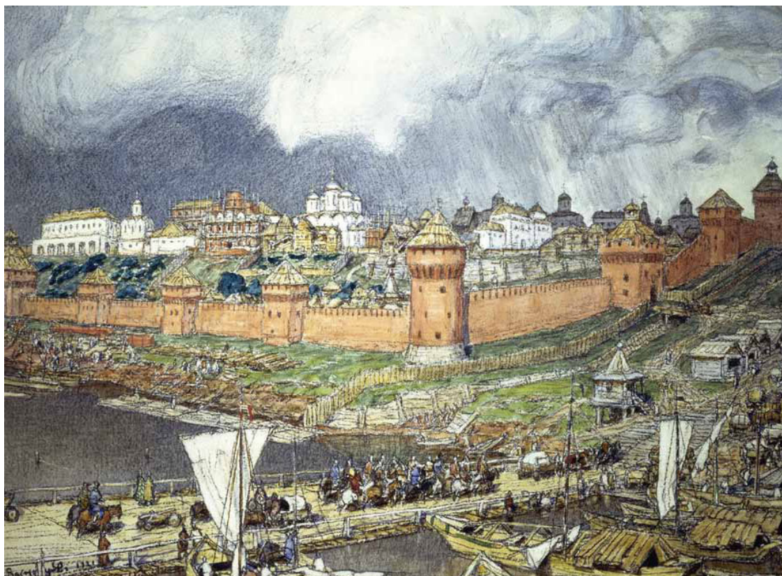
Московский Кремль при Иване III. Художник А. Васнецов. 1921 г.

Крупнейшей кампанией, к которой оказался причастен Иван III, стала война с Большой Ордой в 1480 г. Ее кульминацией явилось, как известно, «стояние на Угре». Война проходила в условиях конфликта с Ливонским орденом и мятежа Андрея Волоцкого (Большого) и Бориса Углицкого – братьев великого князя, который бесцеремонно нарушил соглашение с ними и не наделил их землями присоединенного в 1478 г. Новгорода (со «смутьянами» ему пришлось помириться, пойдя им на уступки). Хану Большой Орды Ахмату обещал помощь великий князь Казимир. Правда, союзником Москвы был крымский хан Менгли-Гирей.