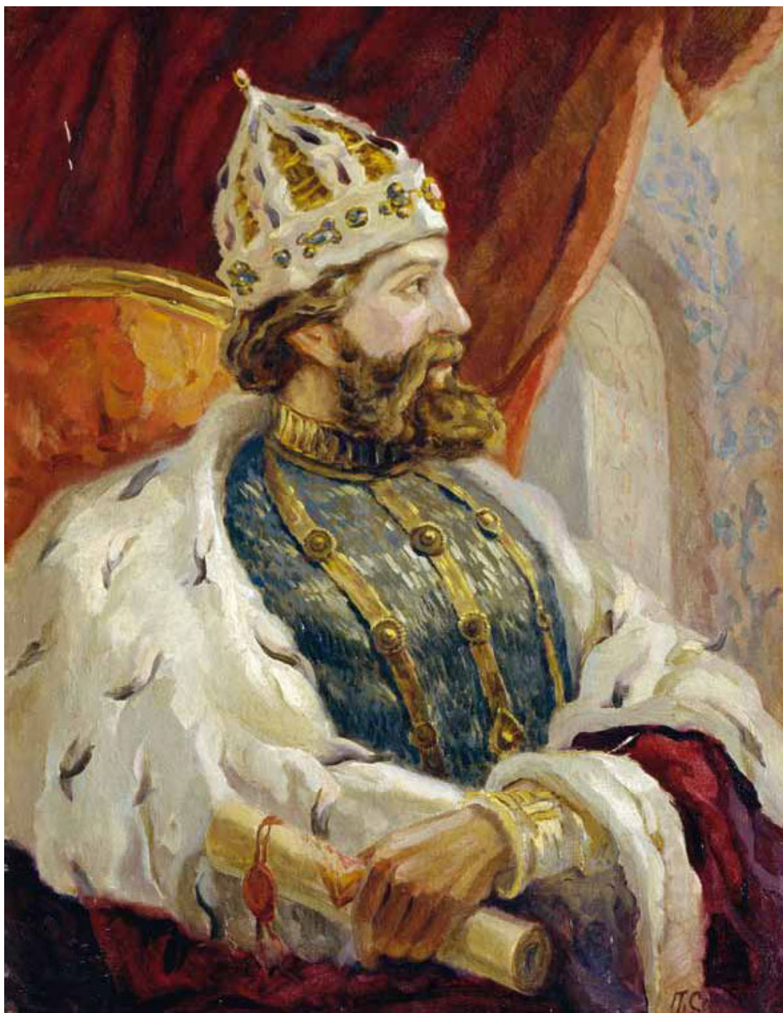
Царь Иван III. Художник Сергеев П. Г.