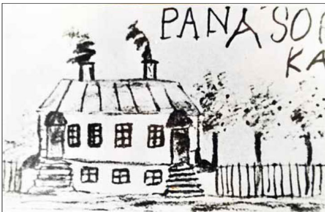
Детский рисунок Ильи Мечникова.

В тот день Илья еще раз подвергся смертельной опасности.