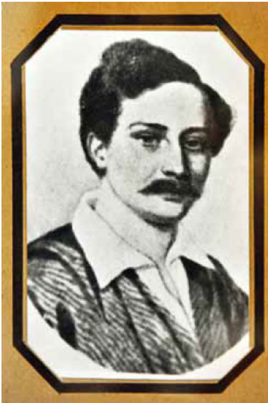
Илья Иванович Мечникова, отец.

На излете светской юности Илья Мечников решил покинуть Петербург.