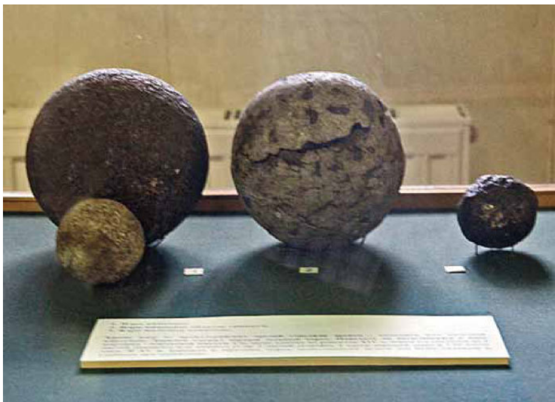
Образцы ядер XV–XVI вв.