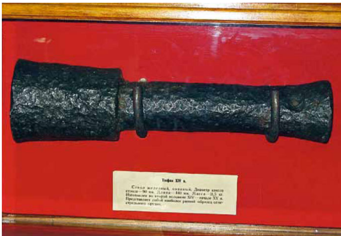
Тюфяк XIV в.

Стреляли они по преимуществу каменным дробом (картечью). Не буду говорить, что скорострельность, прицельность, дальность стрельбы подобных орудий также желали лучшего. Более того, качество пороха и такой тип конструкции приводили к тому, что первые орудия заряжались с казенной части. Патрон с зарядом состоял из металлического сосуда с рукоятью, укреплявшегося в задней части ствола специальными клиньями. Часто случалось, что во время выстрела этот «патрон» разрывался и своими осколками поражал близко стоящих людей, а ствол пушки разлетался вдребезги. Поэтому первые пушкарки перед выстрелом обычно прятались в укрытия или ямы. Тем не менее и такие пушки считались грозным оружием своего времени.