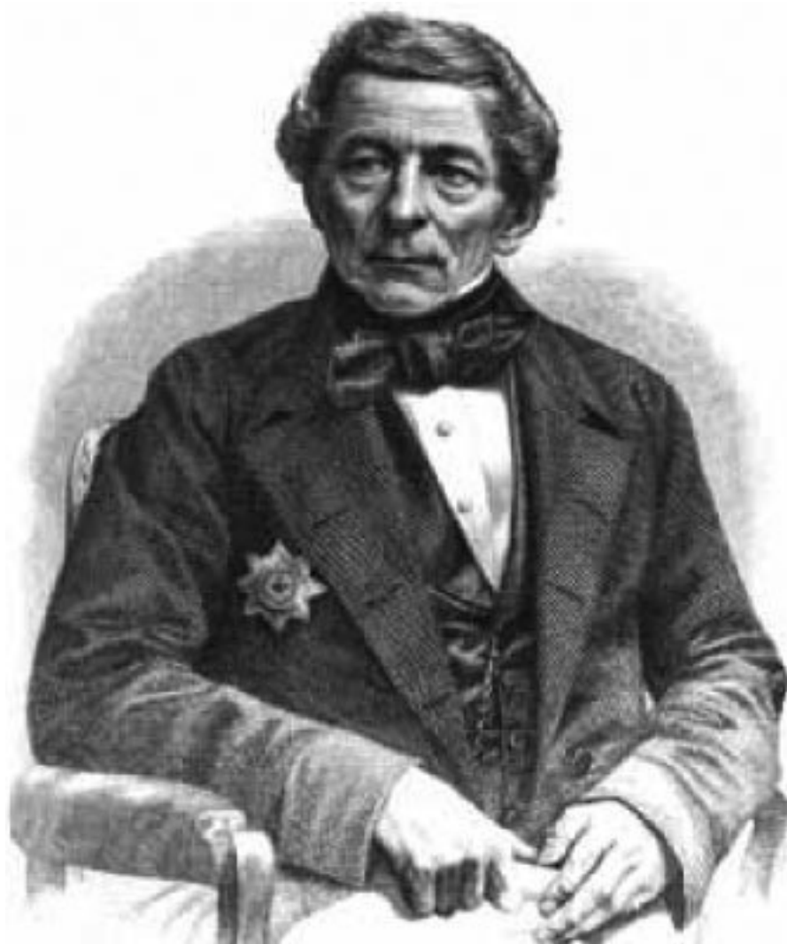
И. Г. Гамель.

Разобраться с содержимым этих ящиков было поручено известному русскому военному историку, музейному организатору и археологу Николаю Ефимовичу Брандербургу. Проведя обследование документов, он установил, что «два ящика пропали, а книги и документы двух других были частично отправлены в Арсенал для переработки». Таким образом, большая часть столь ценных для освещения рассматриваемой темы документов утеряна безвозвратно. Правда, за истекшие полтора века некоторая часть утерянных в войне 1812 г. документов была обнаружена в частных коллекциях, оказалась в разрозненном виде в разных библиотеках или передана обратно в государственные архивы, найдена в копиях в других фондохранилищах. Что же до личности самого Андрея Чохова, то первую попытку систематизировать все сведения, сохранившиеся в русских архивах об этом человеке, предпринял известный русский историк, археограф и первый директор Императорского Исторического музея (ныне ГИМ) Иван Егорович Забелин. После публикации его архивных изысканий в 1872 г. и до сего времени принципиально новых сведений о личности этого выдающегося русского литейщика и инженера найдено не было.