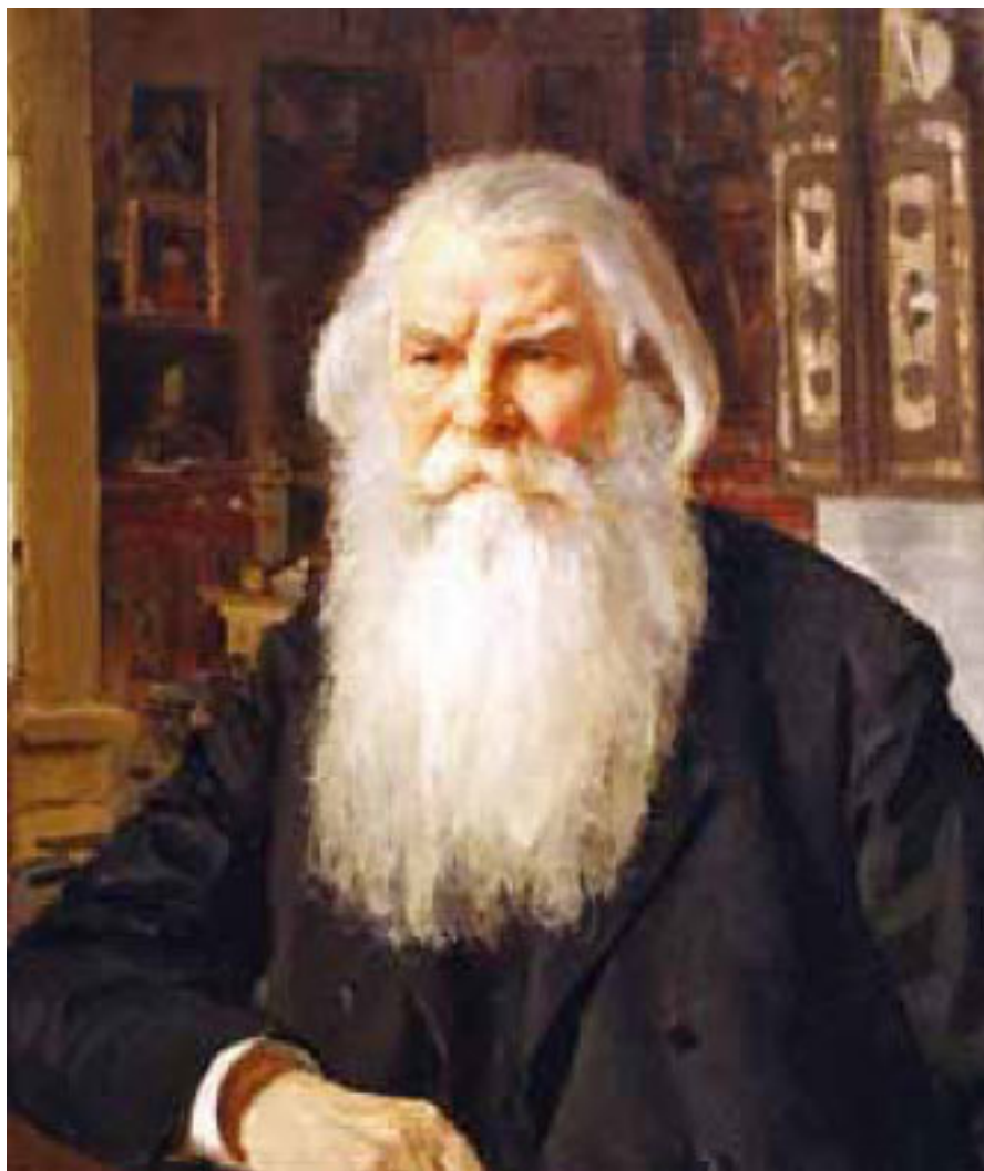
И. Е. Забелин.

Суммируя всю имеющуюся у нас информацию, попробуем если не приоткрыть завесу тайны над личной биографией Андрея Чохова, то хотя бы над тем местом, где он проработал, по сути, всю свою сознательную жизнь, – Московским Пушечным двором.