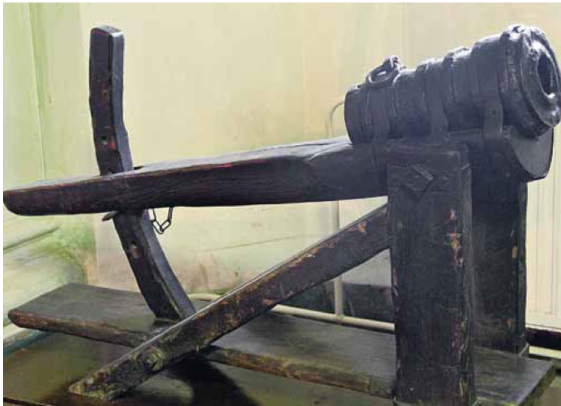
Станок для стрельбы и пушка XV в.

зовал результаты их испытаний сам. Хотя естественно, что за годы практической работы допустимое соотношение меди и олова в бронзе для пушек и колоколов было экспериментально установлено и проверено. Однако ни о какой стандартизации изготовления в то время речи еще не было.