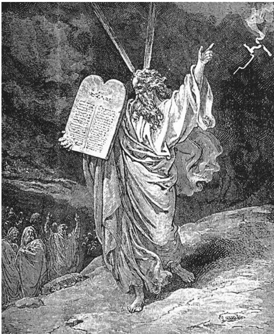
Рис. 1. Моисей открывает людям Бога (картина художника Дорэ).