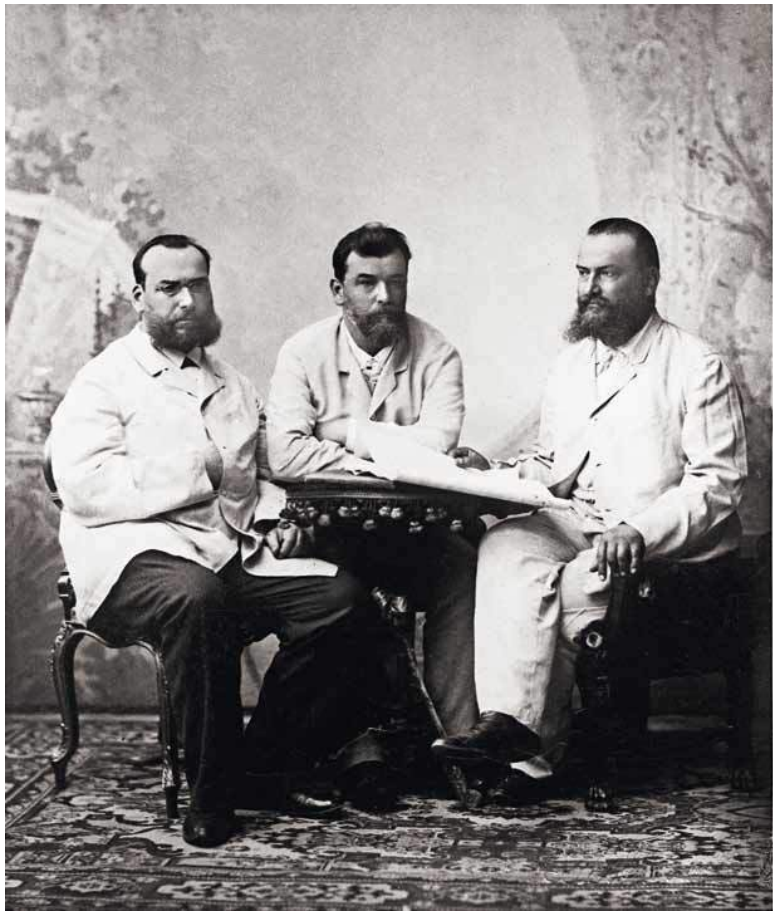
Н. Е. Жуковский со своими братьями Валерианом Егоровичем и Иваном Егоровичем. 90-е годы XIX века.