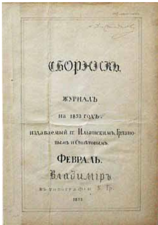
Сборник Столетова в гимназии

Все описание пронизывает глубокая ирония. Она сквозит даже через описание дяди осиротевшего Ферапонта: «Дядя мой был человек якобы приказный; служил в совестном Суде (который, к слову пришлось, вернее нужно было назвать бессовестным), любил брать взятки, или, как говорил, благодарственные приношения неимущему от доброхотных дателей, за что и был один раз под судом».