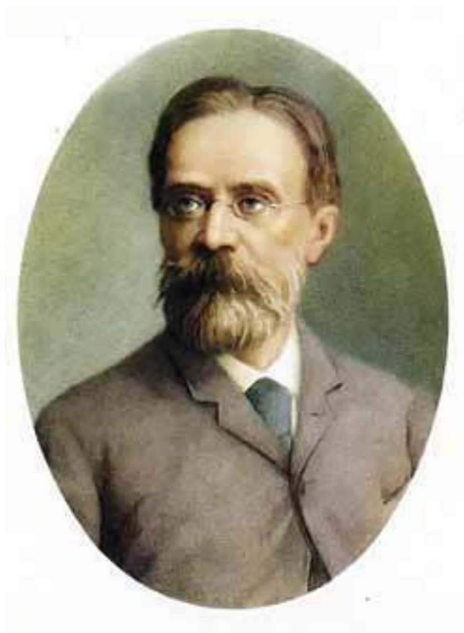
Александр Григорьевич Столетов