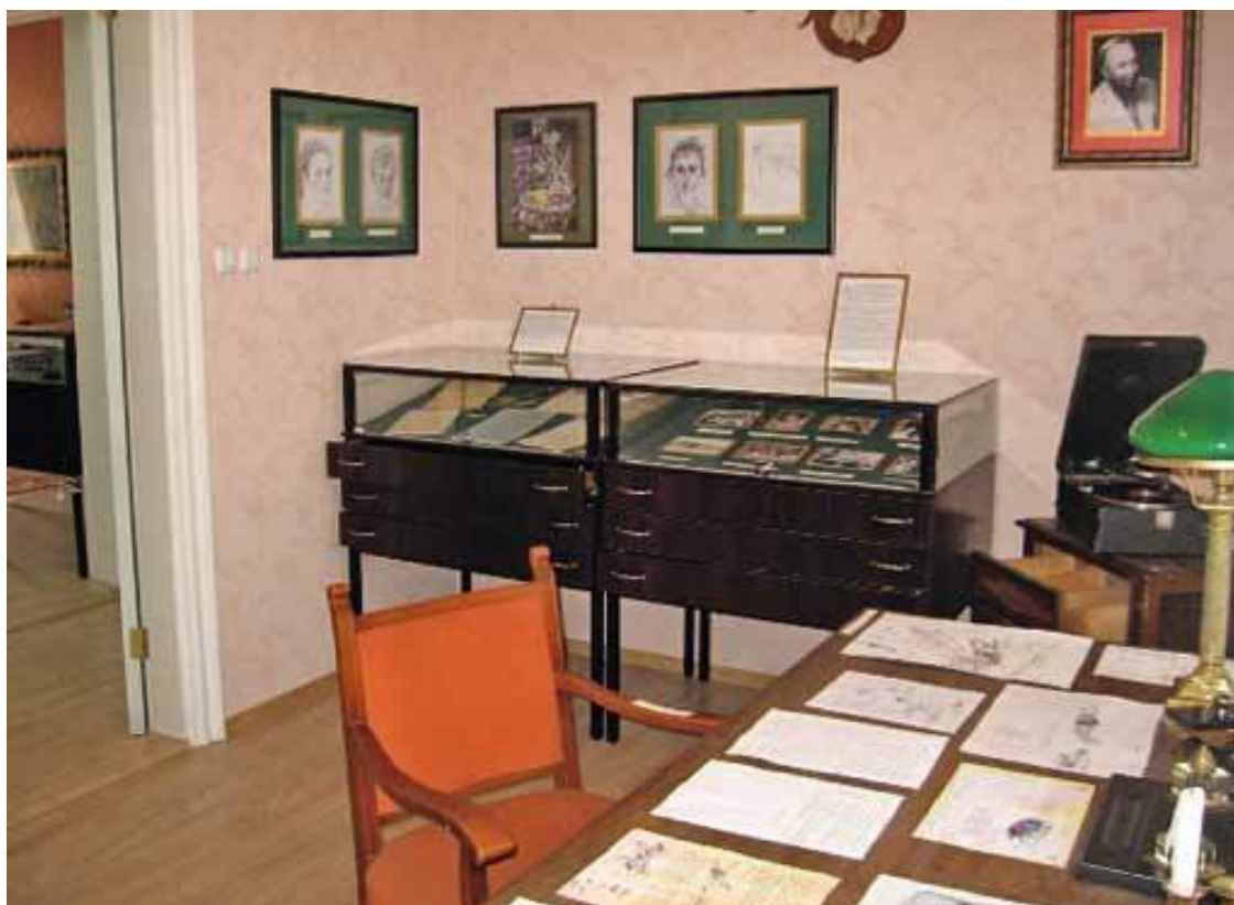
Мемориальный кабинет в Музее истории города Иркутска.