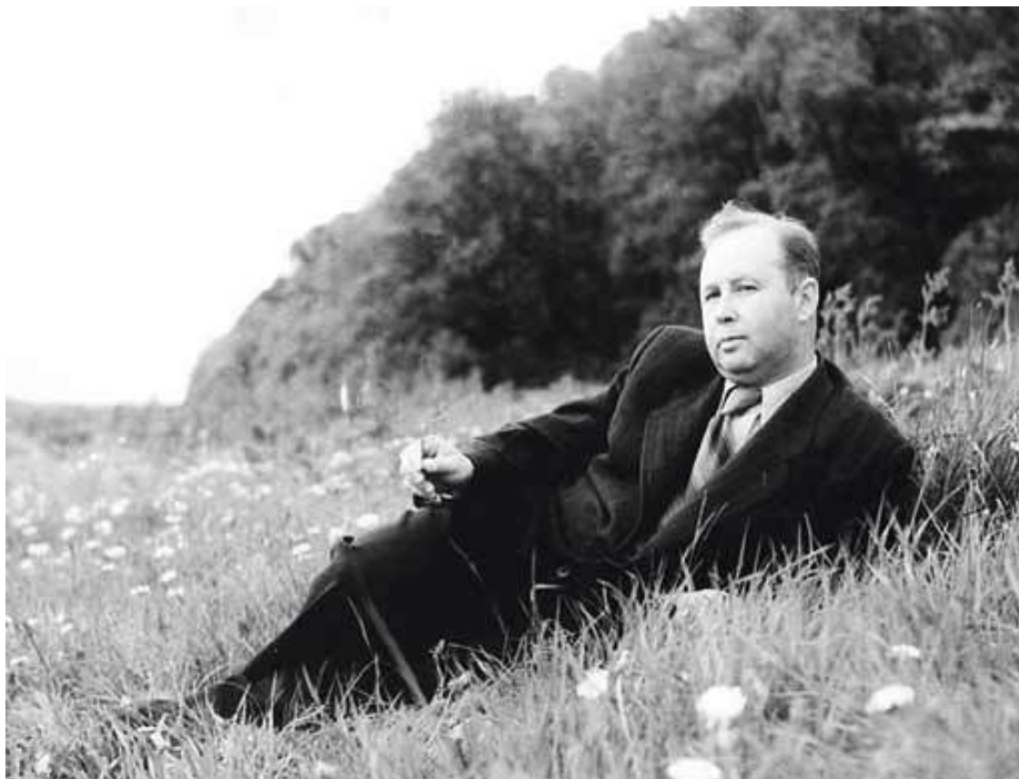
На опушке подмосковного леса.

Михаил Леонтьевич Миль был государственным человеком, патриотом своей Родины. Он всегда ставил своей задачей создавать вертолеты, нужные людям. Он строил вертолеты для экономики своей страны и Вооруженных сил. Еще до утверждения задания правительства на разработку нового вертолета он по своей инициативе проводил эскизное проектирование. Так происходило с тяжелым вертолетом Ми-6, когда проектирование началось за несколько лет до выпуска решения правительства о его создании. Вертолет Ми-24 был предложен именно М. Л. Милем, он упорно добивался решения правительства о создании боевого вертолета, и ему удалось получить поддержку со стороны Министерства обороны СССР.