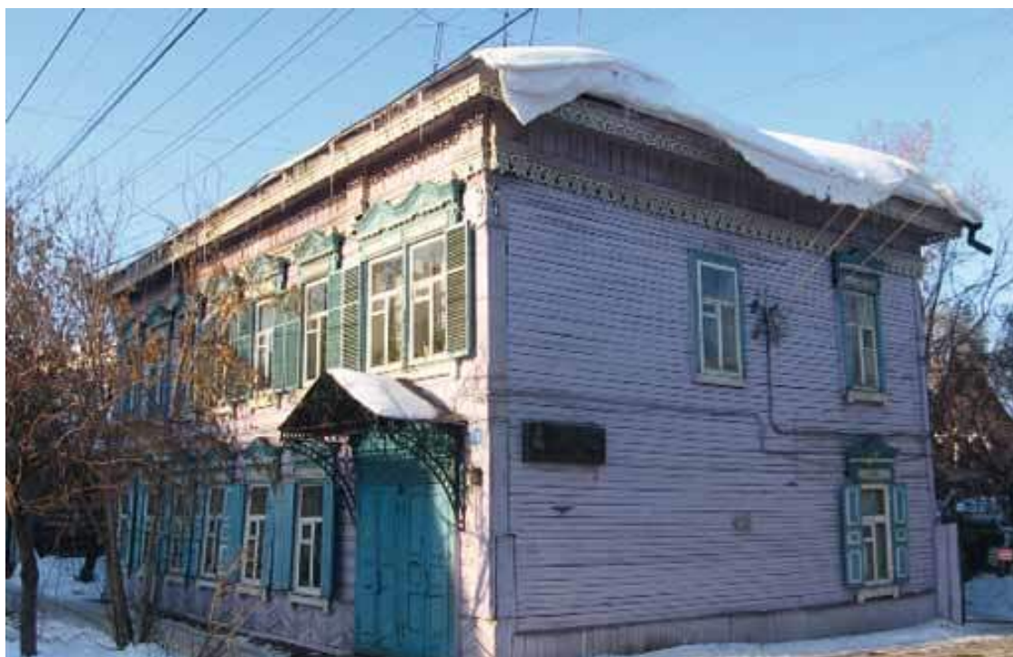
Дом в Иркутске, где родился М. Л. Миль.