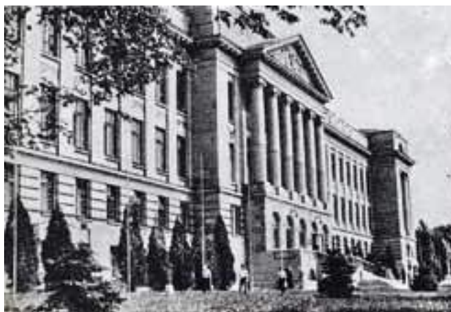
Донской политехнический институт.