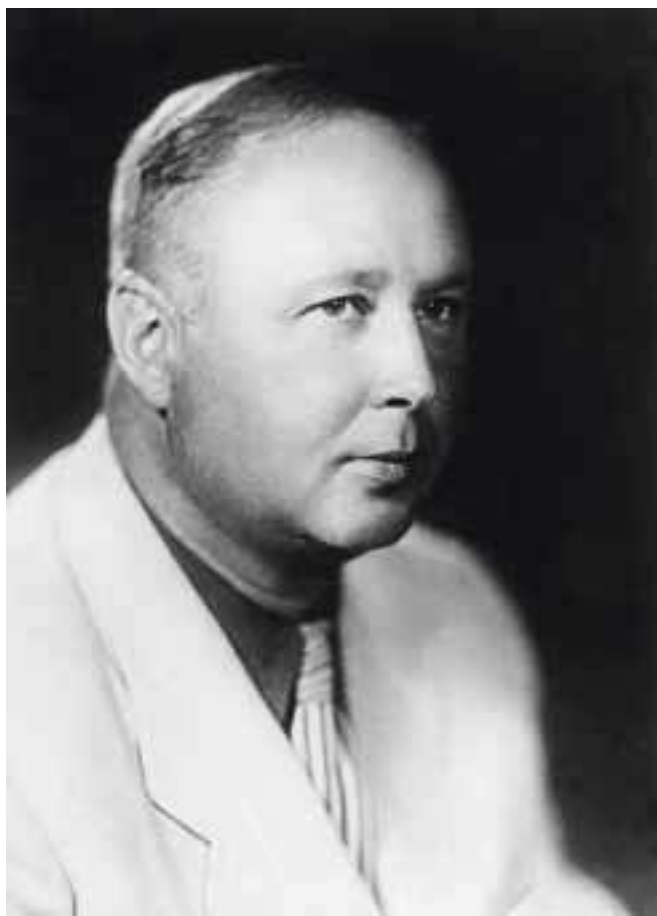
М. Л. Миль, 1959 г.

Многие из нас слышали о том, что существуют вертолеты «Ми», поражающие своими возможностями: они обладают колоссальной маневренностью, грузоподъемностью и надежностью. Но не все знают, что создавались эти вертолеты в СССР советским конструктором Михаилом Леонтьевичем Милем.