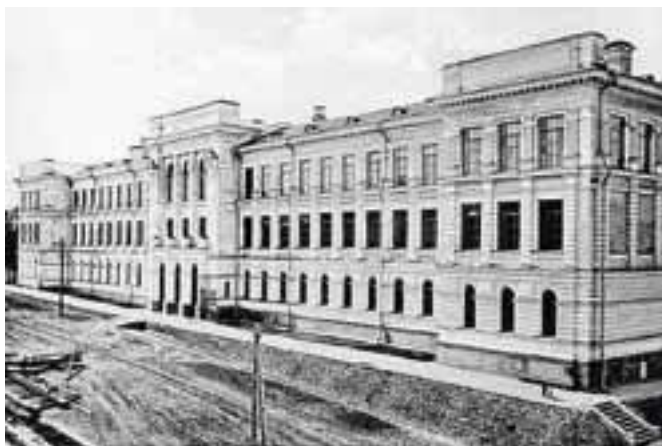
Здание Томского технологического института в начале XX века.

Однако во время учебы на первом курсе у Милия возникли проблемы – его отчислили без всяких на то видимых причин. Михаил Миль попытался выяснить причину отчисления в деканате, но там ему холодным голосом ответили: «Был сигнал о том, что у вас дома есть мягкие стулья». Что это значит? В то время преимущественное право поступления в институт имели дети, происходящие из крестьян и рабочих. В первые годы советской власти государственная политика была направлена на то, чтобы создать особые условия для детей рабочих и крестьян, выучить их на инженеров, врачей, учителей, строителей и других специалистов. Задача создать советскую науку, культуру, технику и не зависеть от специалистов, выучившихся в дооктябрьской России, сочеталась с идеей дать возможность раскрыться талантам из народа. Кроме того, стране нужно было совершить огромный скачок в техническом развитии, из крестьянской страны превратиться в индустриальную державу.