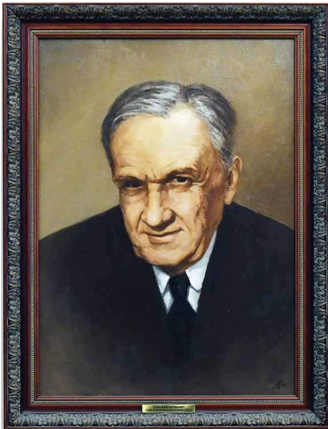
Академик И. Е. Тамм.

С тех пор биографию Игоря Евгеньевича Тамма можно уложить в несколько строк: с 1922 года он в Москве на кафедре теоретической физики МГУ, а затем руководит Теоретическим отделом ФИАН.