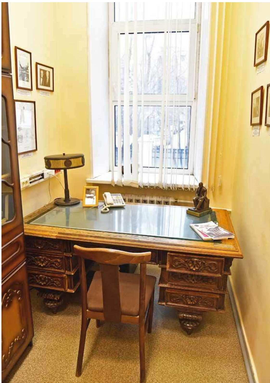
Мемориальный кабинет. За этим столом работали И. Е. Тамм и А. Д. Сахаров.