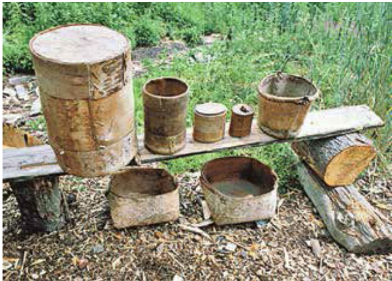
Нехитрый скарб и инструменты Лыковых.