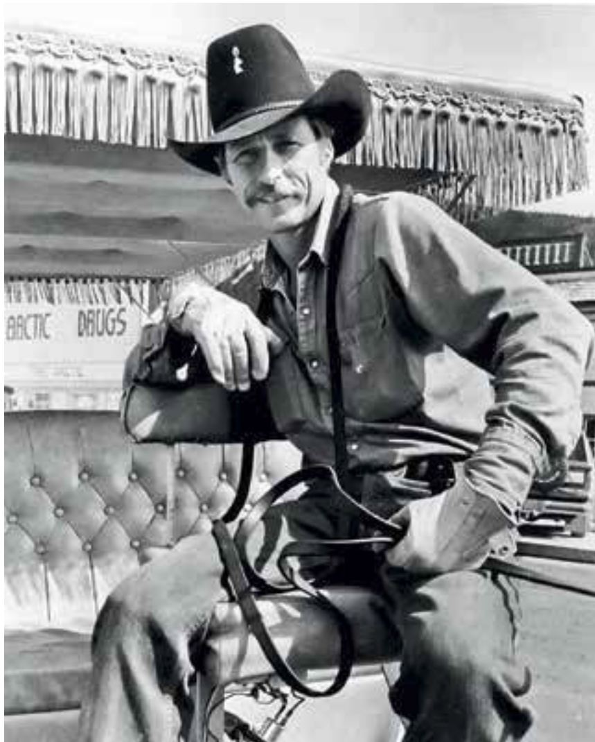
Герой опереточного города – «ковбой».

17 августа 1897 года (история помнит великие даты!) некто Джордж Кормак, ловивший с двумя индейцами рыбу на речке Клондайк, в ручье Бонанза обнаружил золотой самородок. Через несколько дней сотни людей захотели такой же удачи. А когда первые две тонны золотого песка были привезены в Сан-Франциско и телеграф разнес по миру известие о находке золота на Аляске, сто тысяч людей лихорадочным потоком, преодолевая невероятные препятствия, погибая в нехоженных ранее дебрях, устремились на север. Конторщики, плотники, учителя, адвокаты, торговцы, миссионеры, портные, игроки, полицейские – все, кого вынуждала судьба (в Соединенных Штатах это было время депрессии, безработицы) или кто хотел стать богатым немедленно, шли бок о бок по горным увалам, по ледяным тропам, плыли по озерам и по речным каньонам на лодках, а когда воды сковало морозом, тащились вперед на собаках. Конечным пунктом 700-километрового пути был Доусон, до этого никому не ведомое селенье на Юконе, летом изводимое тучами комаров, а зимой морозами в пятьдесят градусов.