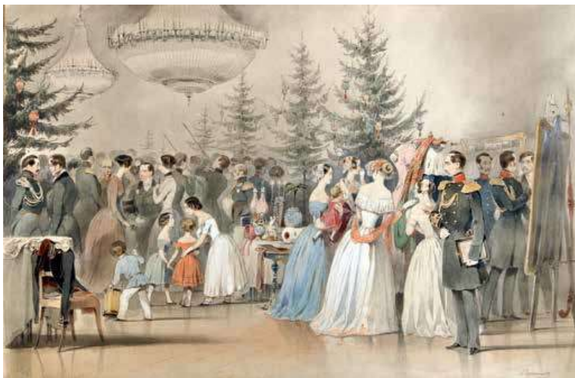
Елка в Зимнем дворце. Акварель А. Ф. Чернышёва. 1848 г.

Конечно, планка, заданная воспитателями, была очень высока. «Знайте только одно, — писал 14-летнему наследнику Жуковский, — что в наше бурное время необходимее, нежели когда-нибудь, чтобы государи своею жизнью, своим нравственным достоинством, своею справедливостью, своею чистою любовью общего блага были образцами на земле и стояли выше остального мира». За пафосом этой фразы можно увидеть довольно необычную по тем временам мысль. А разве государь уже не стоит выше остального мира по праву рождения и помазания на царство? Нет, по Жуковскому выходило, что это право надо еще заслужить. А если не получится? Да и не являлась ли заведомо невыполнимой задача «стоять выше остального мира»?