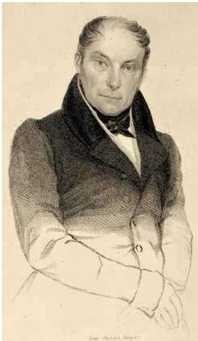
В. А. Жуковский. С гравюры Т. Райта. Первая треть XIX в.

22 апреля 1834 года, в день Святой Пасхи, достигший совершеннолетия Александр принес торжественную присягу «в верности государю и Отечеству». С этого дня началось формальное приобщение наследника к государственной деятельности: он был назначен присутствовать в Сенате и Синоде, а также стал генералом свиты отца. Однако 16-летие не означало, что образование будущего императора закончено: согласно плану Жуковского он еще должен был пройти высшую математику, физику, астрономию, историю, географию, статистику и финансы, право, литературу, политическую экономию, а также целый ряд военных наук. Преподавателями теперь были уже не только профессора, но и крупнейшие государственные деятели империи: М. М. Сперанский, министр финансов Е. Ф. Канкрин, видный дипломат Ф. И. Бруннов, крупный военачальник генерал А. А. Жомини.