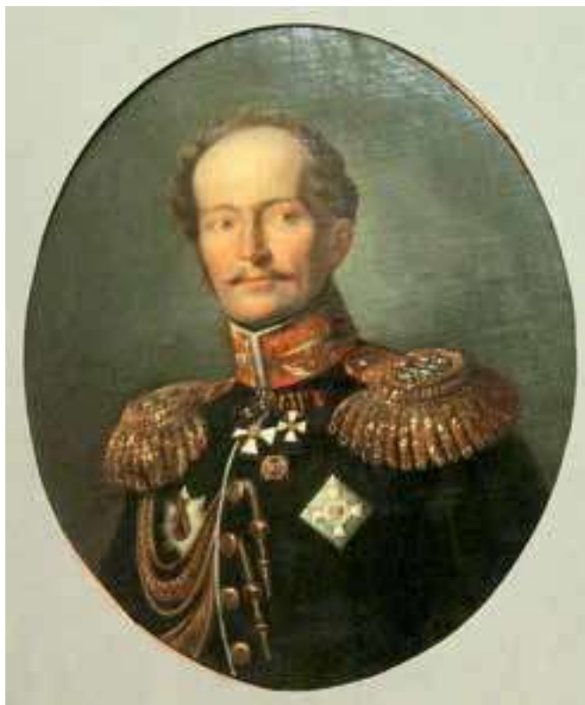
Карл Карлович Мердер. 1830-е гг.

Судя по всему, выбор Мердера на роль воспитателя наследника оказался очень удачным. Постоянное обращение к чувствам, к внутреннему миру воспитанника дополняло внешнюю строгость воспитания, гуманизировало его представления о мире и о своем месте в нем. Возможно, чувствительность, которую в нем культивировали, была несколько поверхностной, но она была искренней. Очень тонко уловил эту черту молодой Александр Герцен, познакомившийся с наследником, когда тому было уже около 20 лет: «Вид наследника не выражал той узкой строгости, той холодной беспощадной жестокости, как вид его отца; черты его скорее показывали добродушие и вялость». Наследник в эти годы нередко играл предписанную ему ритуалом роль заступника перед отцом, прося его проявить «милость к падшим»: наказанным, сосланным, обиженным судьбой. Но делал он это совсем не ритуально, а очень искренне, радуясь возможности помочь людям.