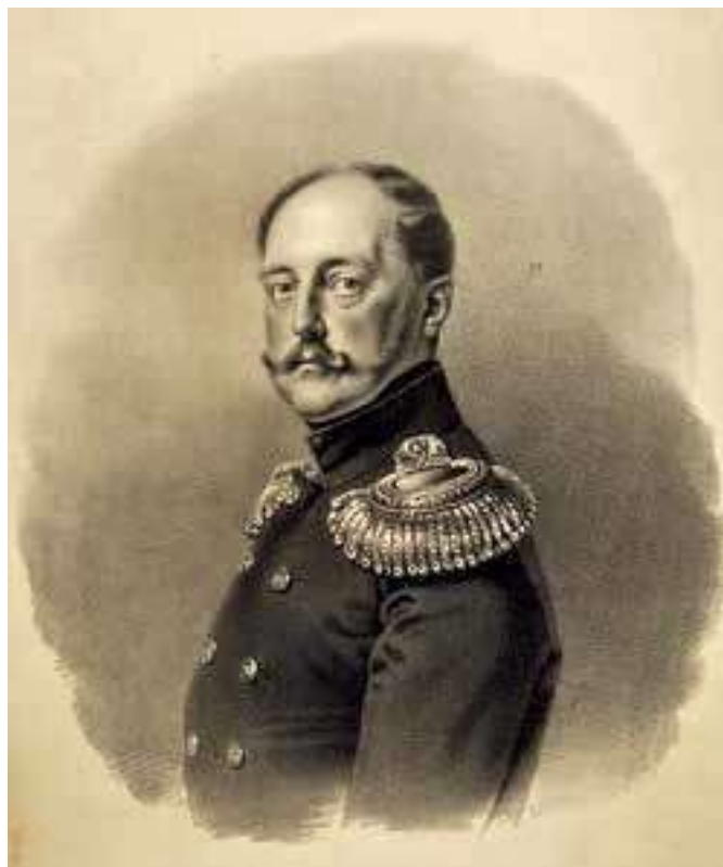
Николай I. Гравюра с портрета Ф. Крюгера. Первая треть XIX в.