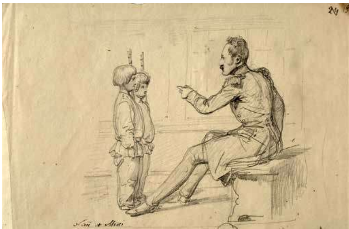
Николай I с младшими сыновьями Николаем и Михаилом. Рисунок О. Верне. 1830-е гг.