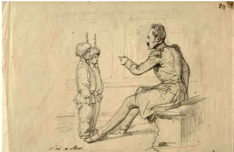
Николай I с младшими сыновьями Николаем и Михаилом. Рисунок О. Верне. 1830-е гг.