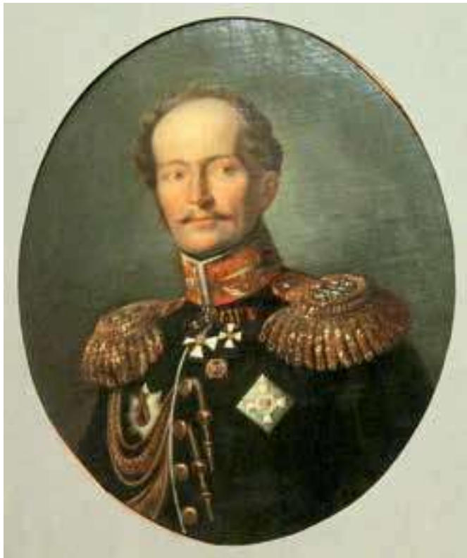
Карл Карлович Мердер. 1830-е гг.

Судя по всему, выбор Мердера на роль воспитателя наследника оказался очень удачным. Постоянное обращение к чувствам, к внутреннему миру воспитанника дополняло внешнюю строгость воспитания, гуманизировало его пред-