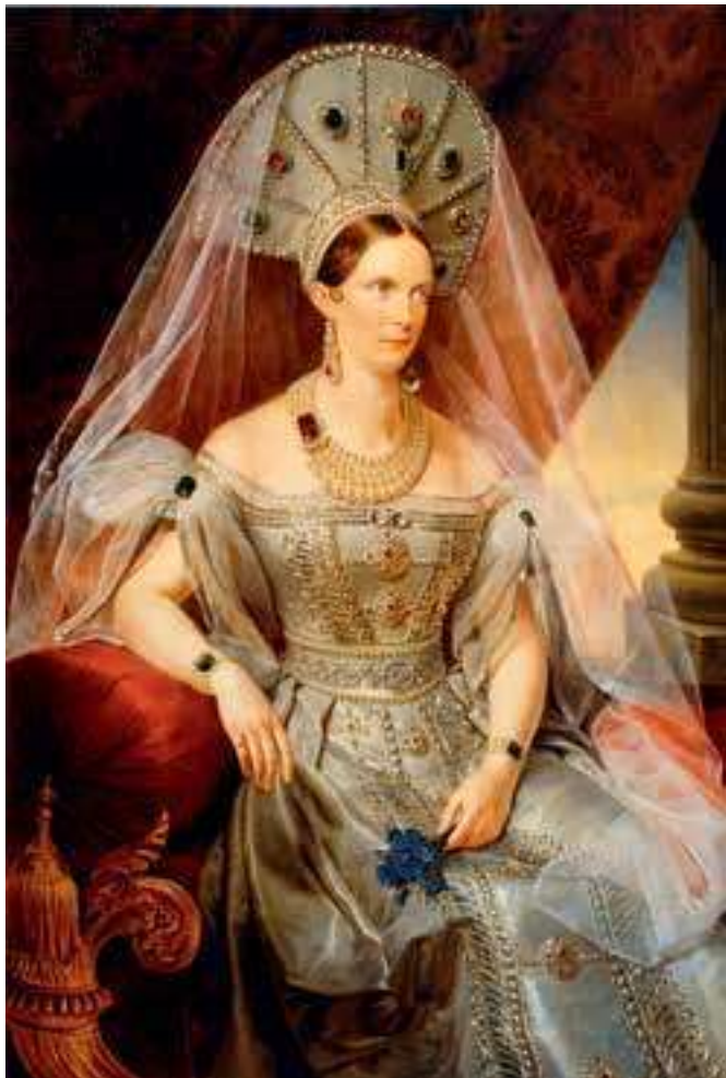
Императрица Александра Фёдоровна в русском придвор-