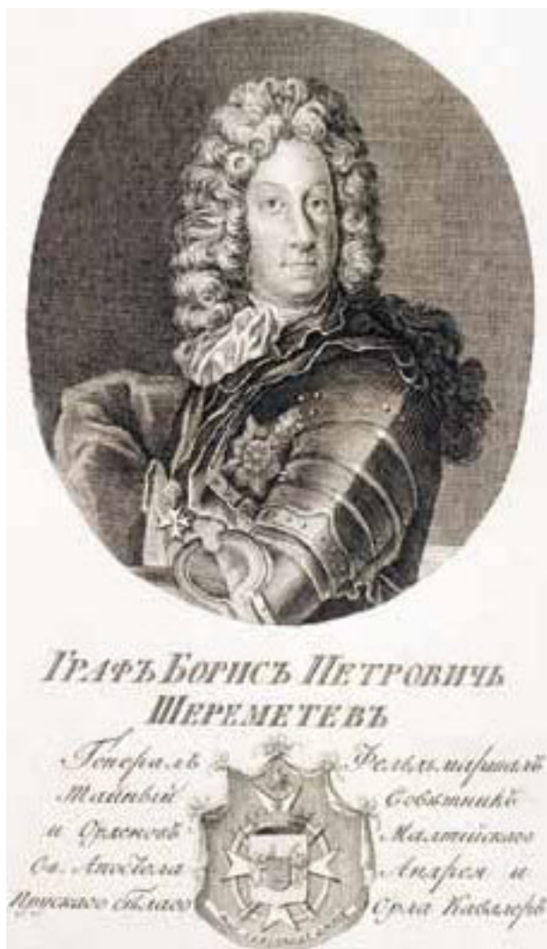
Б. П. Шереметев.

Дипломатическая стезя лучше военной соответствовала наклонностям и дарованиям умного, но осторожного Бориса Петровича. Однако своевольная Судьба решила иначе и повела его по жизни далеко не самой удобной дорогой. По возвращении из Европы в Москву боярину вновь пришлось надеть военный мундир, который он уже не снимал до самой смерти.