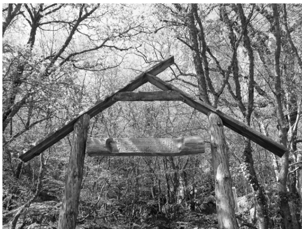
Оформленный вход на экотропу «Чёртова лестница» со стороны Южного берега Крыма

Прощавшись с мрачным Драконом, мы продолжаем путь вдоль Байдаро-Кастропольской стены. На первый взгляд горы здесь кажутся неприступными. Но это впечатление обманчиво. Над курортным поселком Меллас горы понижаются, образуя впадину. И именно там проходит старейшая дорога, сегодня больше напоминающая тропу, некогда бывшая единственным путем, соединявшим Южный берег Крыма с остальной частью полуострова. Этот путь пролегал через перевал Шайтан-Мердвен, что в переводе с тюркского означает «Чертова лестница».