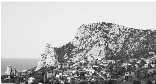
Гора Кошка и скала Крыло лебедя

Великолепный ландшафтный памятник Южного берега Крыма, гора Кошка, является украшением курортного поселка Симеиз, его визитной карточкой. Высота горы 255 м над уровнем моря, возраст около миллиона лет, так что по сравнению с другими вершинами Крыма Кошка относительно молода.